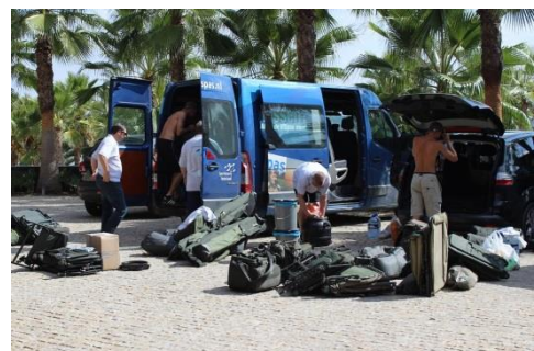
Zwoegen bij het omladen