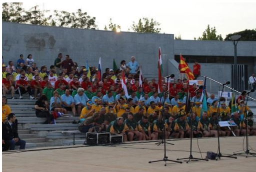
De helft van de 20 aanwezige landen

De verrichtingen van het WK team zijn ook te volgen via de Facebook pagina van De KSN. https://www.facebook.com/pages/De-KSN/152140768234240?ref=hl