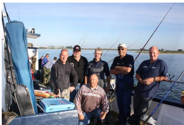
De Nederlandse ploeg