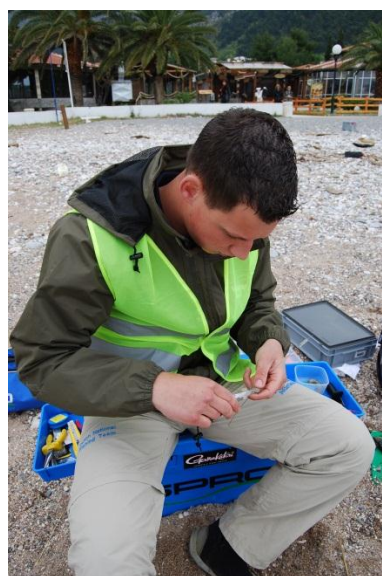
Adriaan aast zorgvuldig aan