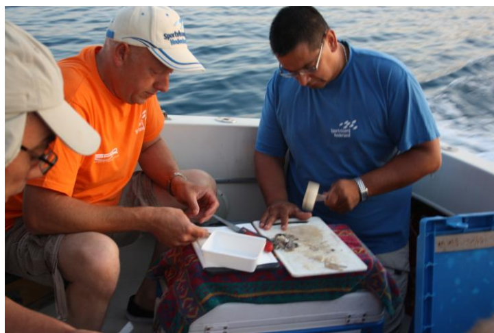
Gereed maken van het aas

Het blijkt de juiste keuze, die we hebben gemaakt wat betreft de materialen, zoals lood, onderlijnen en hengels met molens. De molens van Spro, de fluoro carbon lijnen in combinatie met Gamakatsu haken LS 1050 N, maat 10 bleken de juiste keuze te zijn. Wij zijn dan ook de firma Spro zeer erkentelijk voor hun bijdrage met hun materialen hierin.