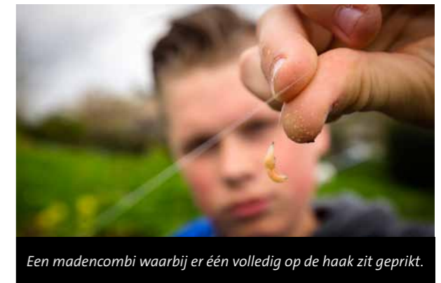
Een madencombi waarbij er één volledig op de haak zit geprikt.