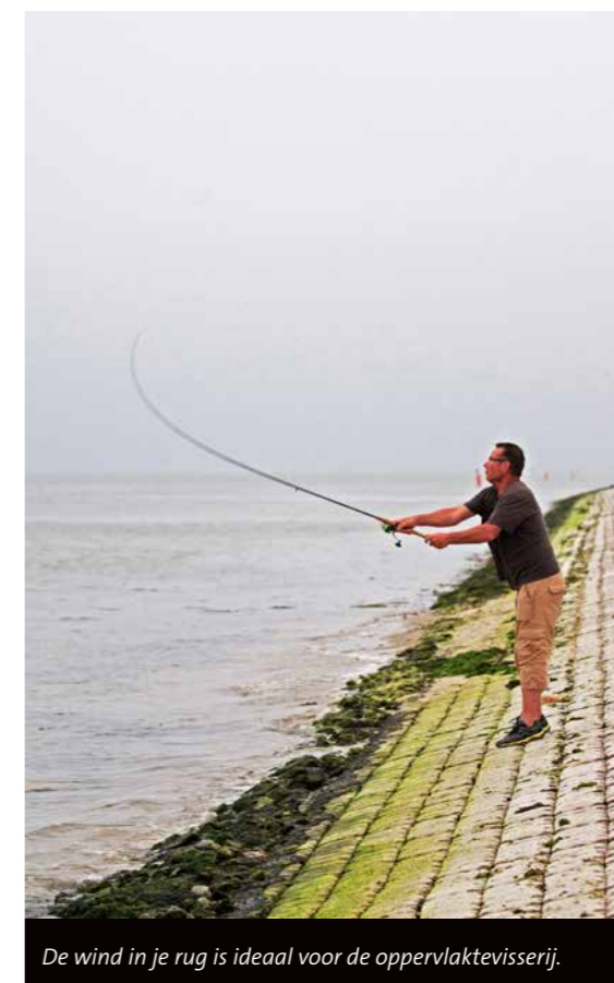
De wind in je rug is ideaal voor de oppervlaktevissers.