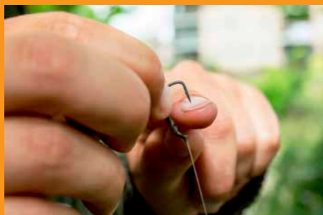
Check na iedere vangst of de haakpunt nog goed scherp is.