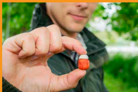
In de koudere maanden werkt een halve, witte pop-up boilie extra interesse van de karper.

de onderlijn direct door een vers exemplaar. Die heb ik thuis al geknoopt, zodat ik geen tijd verlies.”