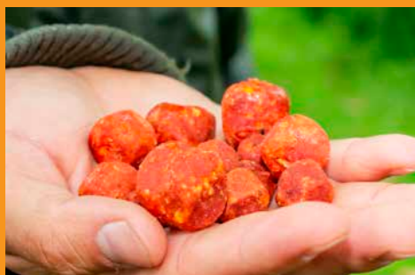
Voer boilies in verschillende diameters om dressuur te voorkomen.