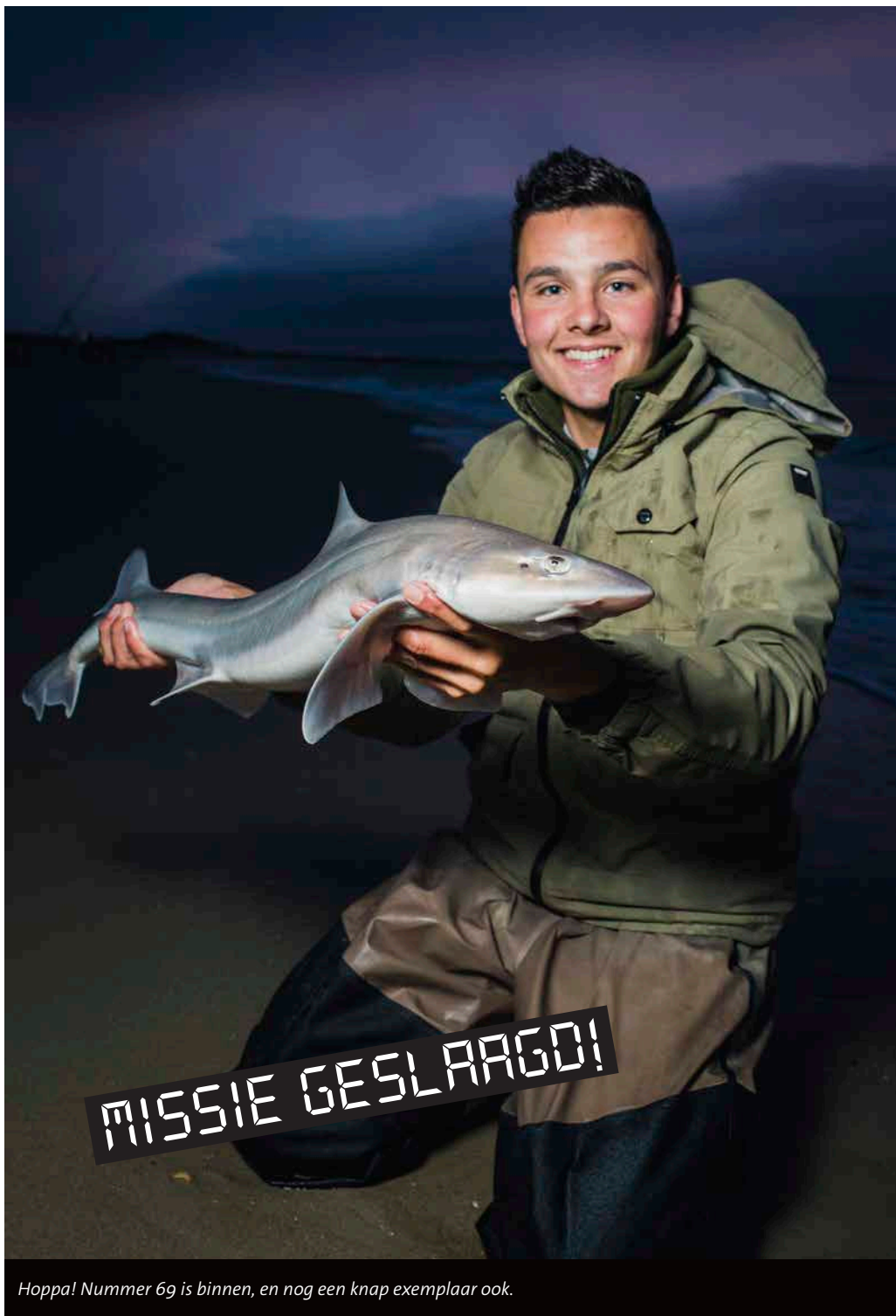
Hoppa! Nummer 69 is binnen, en nog een knap exemplaar ook.