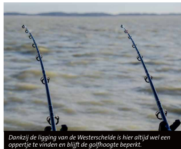
Dankzij de ligging van de Westerschelde is hier altijd wel een oppertje te vinden en blijft de golfhoogte beperkt.