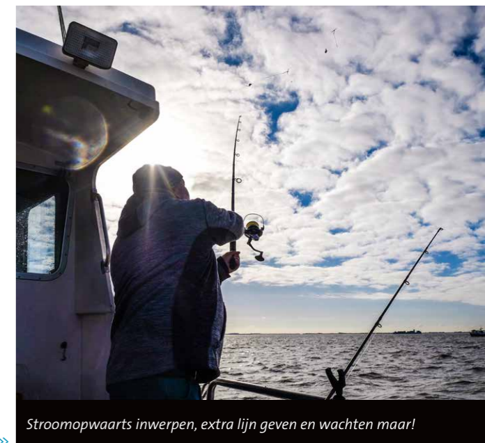
Stroomopwaarts inwerpen, extra lijn geven en wachten maar!

Na het inwerpen zet iedereen zijn hengel in de speciale hengelsteu-