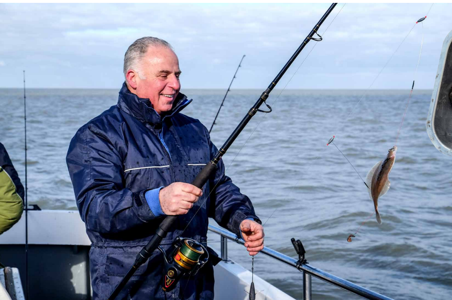
De periodes van november tot januari en van maart tot en met mei vormen de toptijd voor het ankervissen op de Westerschelde.