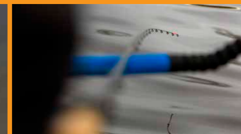
'Sit on your hands', luidt een Engelse feedervijshouding. Sla dus pas aan zodra de aanbeet doorzet.