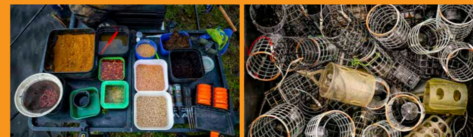
Zorg dat je altijd voldoende kunt variëren qua aassoort en type voerkorf.