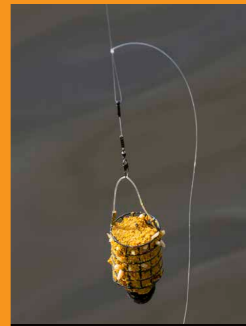
De montage is basic en simpel.