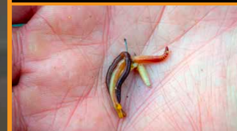
Is de grotere brasem op de stek gearriveerd, schuif dan ook eens een piertje op de haak.