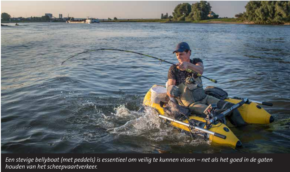
Een stevige bellyboat (met peddels) is essentieel om veilig te kunnen vissen – net als het goed in de gaten houden van het scheepvaartverkeer.