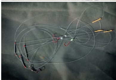
Simpel doch subtiel voor de korte afstand: 125 gram werpgewicht, extra dunne afhouders, en zijlijntjes en haakmaatje zes.