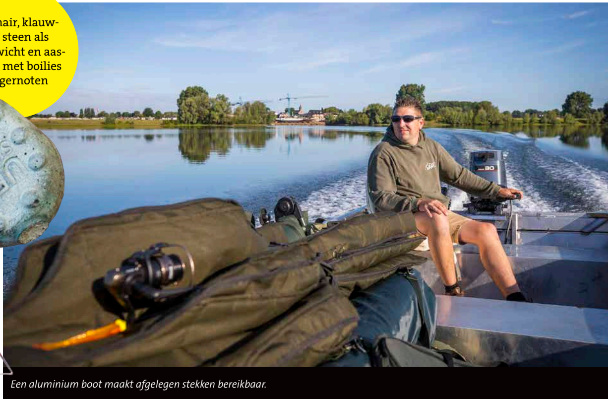
Een aluminium boot maakt afgelegen stekken bereikbaar.

Lange hair, klauw- haak, steen als werpgewicht en aas- variatie met boilies en tijgernoten