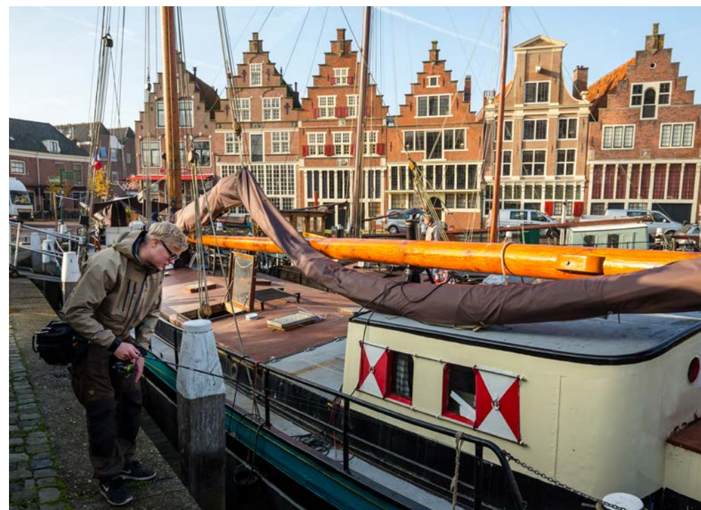
Vergeet het water tussen wal en schip niet uit te peuteren.