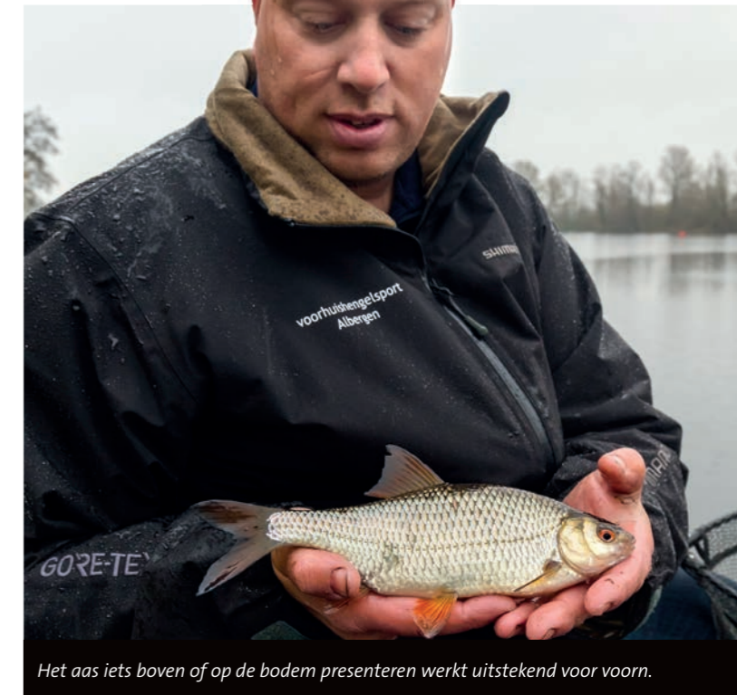
Het aas iets boven of op de bodem presenteren werkt uitstekend voor voorn.

De laatste tip is essentieel voor een geslaagde wintersessie: goede kleding. Zo zorg je ervoor dat je warm blijft en je je op het vissen kunt concentreren. Tegenwoordig zijn er goede – lees: warme en waterdichte – vispakken verkrijgbaar, dus aan de waterkant hoef je het niet koud te krijgen. Laat je ook niet afschrikken door een beetje kou: als het de nacht tevoren gevoren heeft, is het overdag vaak mooi weer met een lekker winterzonnetje. Dat zijn hele mooie dagen om aan het water te zitten.