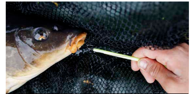
‘Ook met penvissen op karper is een hakensteker vaak handig.’