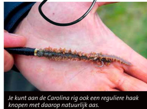
Je kunt aan de Carolina rig ook een reguliere haak knopen met daarop natuurlijk aas.

Bij de Carolina rig bevestig je het kunstaas op een zogenaamde offset haak maat 1, 2 of 4 – afhankelijk van het formaat kunstaas. Dit type haak zit als het ware verstopt in je kunstaas, zodat je op vrijwel ieder type ondergrond terecht kunt – je kunt zelfs over oesterbankjes heen vissen zonder continu vast te zitten. Vis je op het strand en een zandbodem zonder obstakels, dan kun je de Carolina rig zelfs met een reguliere haak vissen. Bijvoorbeeld een F314 of een Worm 36 haak van Gamakatsu. En mocht kunstaas onverhoopt geen enkel resultaat opleveren, dan leent deze rig zich ook uitstekend voor het vissen met natuurlijk aas. Je kunt de offset haken namelijk ook prima beazen met een zager of een stevige pier. Zo kun je op de moeilijkere dagen toch vaak nog succesvol zijn.