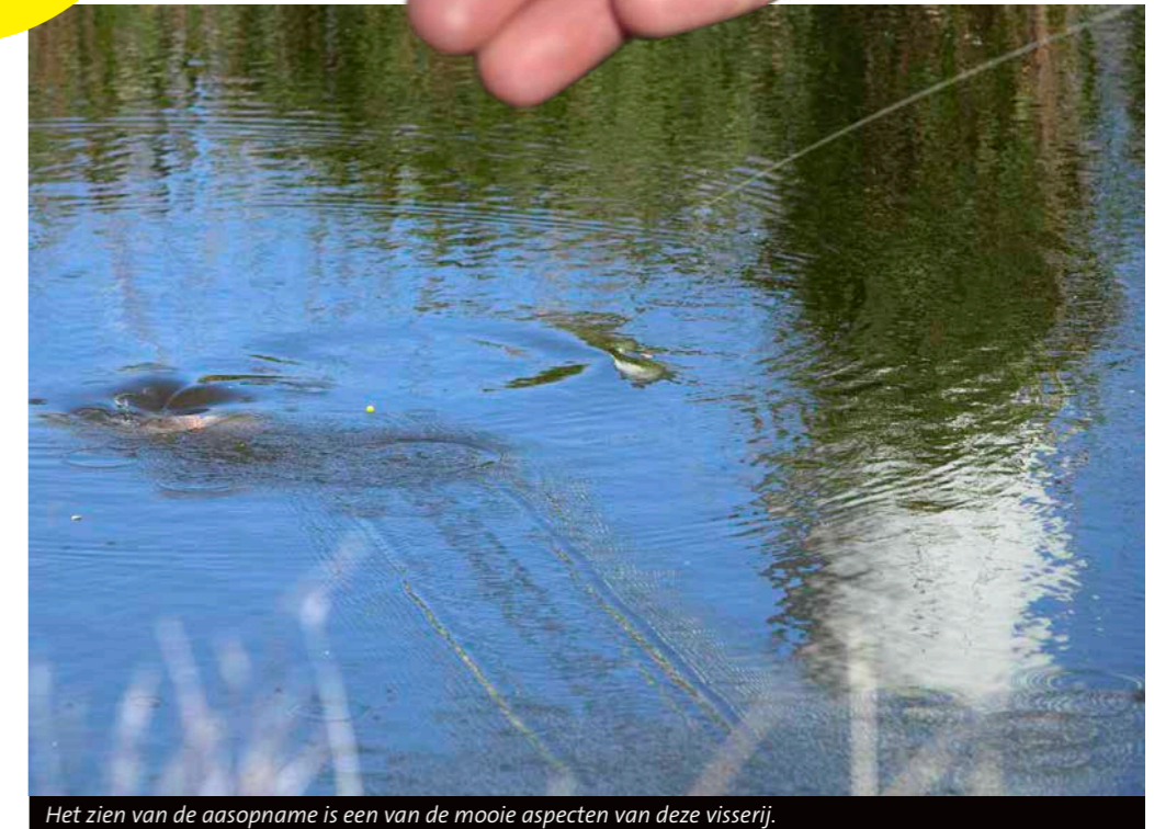
Het zien van de aasopname is een van de mooie aspecten van deze visserij.