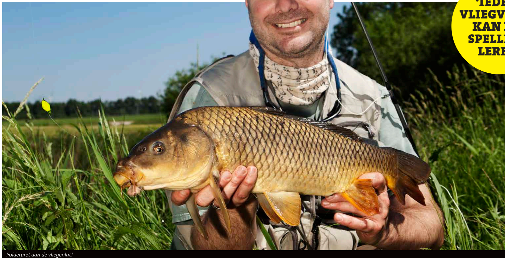
Polderpret aan de vliegenlat!

'IEDERE VliegVissER KAN DIT SPELLETJE LEREN'