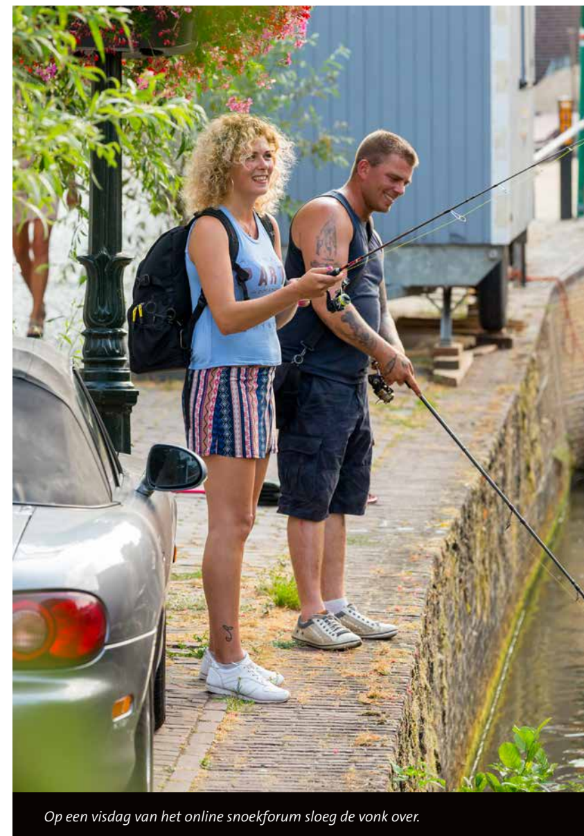
Op een visdag van het online snoekforum sloeg de vonk over.