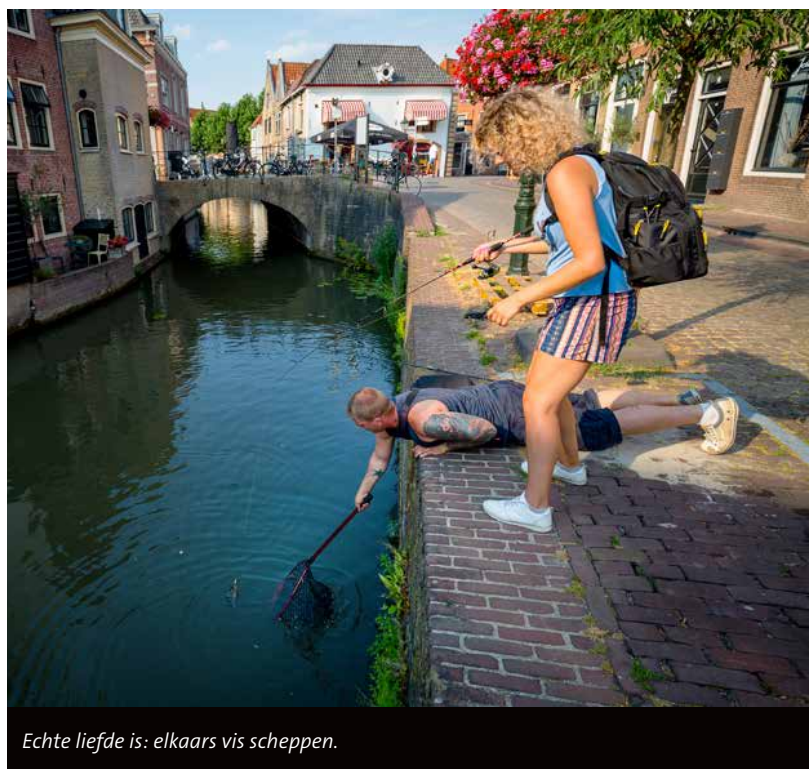
Echte liefde is: elkaars vis scheppen.