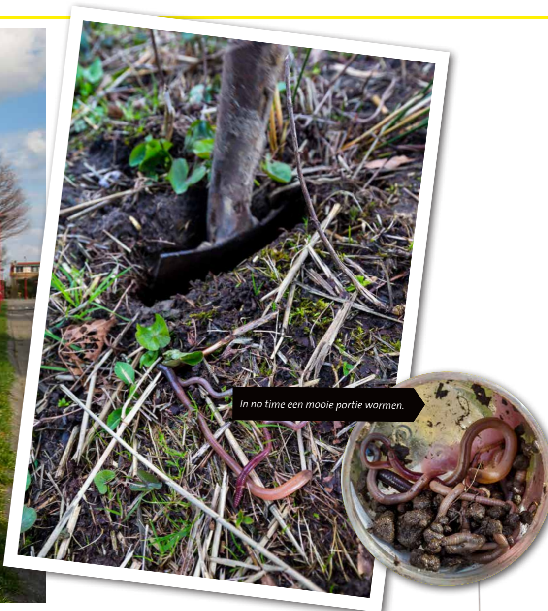
In no time een mooie portie wormen.