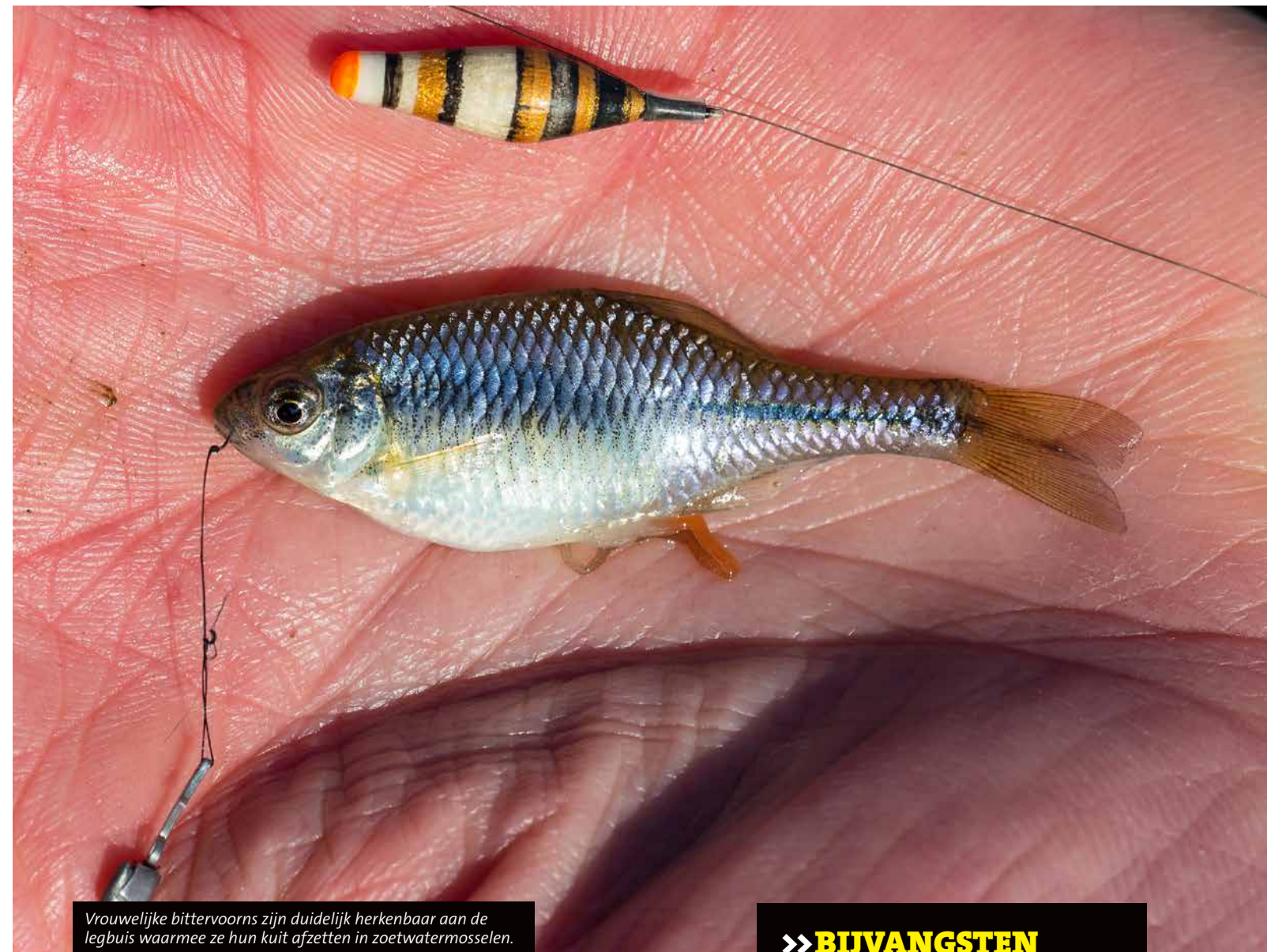
Vrouwelijke bittervoorns zijn duidelijk herkenbaar aan de legbuis waarmee ze hun kuit afzetten in zoetwatermosselen.

In de schelpen van de mossels zetten vrouwelijke bittervoorns via de legbuis in het voorjaar hun kuit af. Daar zijn de visseneitjes verzekerd van zuurstofrijk water en blijven ze beschermd tegen kuitrovers zoals zonnebaars.” Ook helder en plantenrijk water met een klein beetje stroming zijn kenmerkend voor bittervoornstekken. “Overhangende oeverplanten zijn tevens welkom, want daaronder vindt het visje beschutting zodat je pal onder het kantje kunt vissen.” Meerdere poldersloten rondom Hugo's woonplaats voldoen aan deze eigenschappen. Of er ook daadwerkelijk bittervoorn zit, is telkens een kwestie van proberen. “Rijdend door de polder pik ik de meest kansrijke plekjes er tegenwoordig vrij snel uit”, aldus Hugo. “Een vlugge test-sessie geeft vervolgens uitsluitsel.”