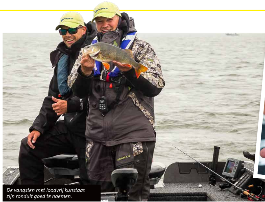
De vangsten met loodvrij kunst-aas zijn ronduit goed te noemen.

Oostdam legt uit dat deelnemers vrij zijn in hun keuze met wat voor kunst-aas ze vissen, zolang het maar loodvrij is. Kritiek op deze regel ervaart hij niet echt. "Verandering roept normaliter altijd wel iets van weerstand