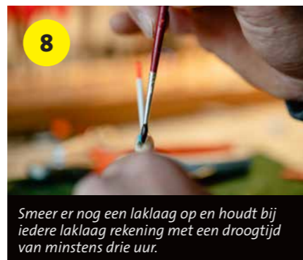
8 Smeer er nog een laklaag op en houdt bij iedere laklaag rekening met een droogtijd van minstens drie uur.