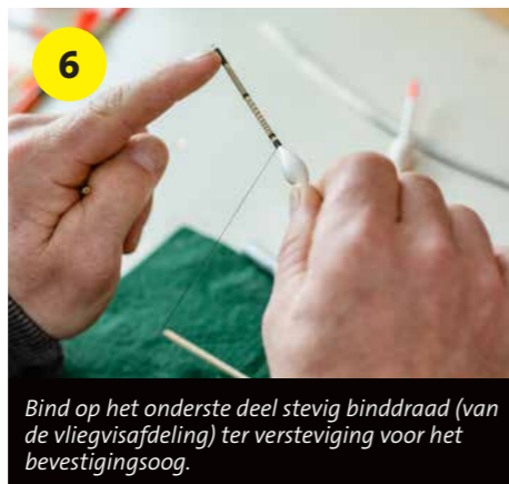
6 Bind op het onderste deel stevig binddraad (van de vliegvisafdeling) ter versteviging voor het bevestigingssoog.