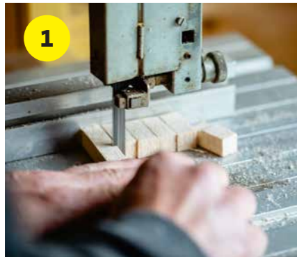
1 Zaag van de balk balsa-hout stukjes van ongeveer 4 bij 1 centimeter.

Heb je de ambitie om ook je eigen pen- netjes te maken? Richard laat in dit stap- penplan zien hou jij jouw eigen pennen fabriceert. De benodigdheden: balsa- hout, satéprikkers, grondverf, model- bouwverf, secondelijm, dun staaldraad, binddraad en blanke lak. Qua gereed- schap gebruikt hij een lintzaag, draai- bank, beitel, kleine boortjes, penseel, stanleymes en schuurpapier.