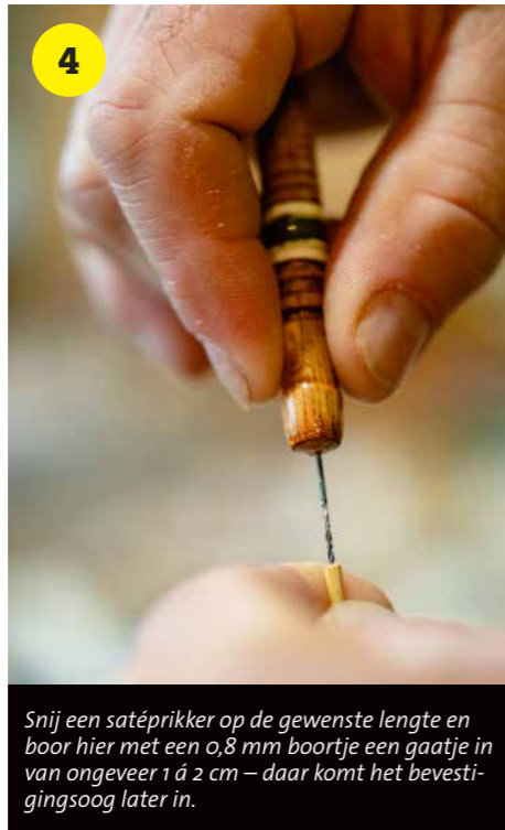
4 Snij een satéprikker op de gewenste lengte en boor hier met een 0,8 mm boortje een gaatje in van ongeveer 1 á 2 cm – daar komt het bevestigingssoog later in.