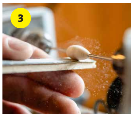
3 Zet de draaibank aan en druk voorzichtig een beitel of stanleymes tegen het balsa. Door de zachte structuur slijp je als het ware de dobbervorm.