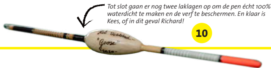
10 Tot slot gaan er nog twee laklagen op om de pen écht 100% waterdicht te maken en de verf te beschermen. En klaar is Kees, of in dit geval Richard!