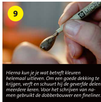
9 Hierna kun je je wat betreft kleuren helemaal uitleven. Om een goede dekking te krijgen, verft en schuurt hij de geverfde delen meerdere keren. Voor het schrijven van namen gebruikt de dobberbouwer een fineliner.