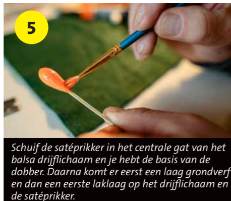
5 Schuif de satéprikker in het centrale gat van het balsa drijflichaam en je hebt de basis van de dobber. Daarna komt er eerst een laag grondverf en dan een eerste laklaag op het drijflichaam en de satéprikker.