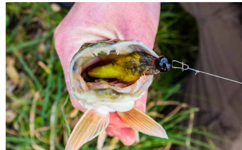
De Bullhead 9 is lekker zacht en beweeglijk, maar scheurt niet zomaar uit op snoektanden.