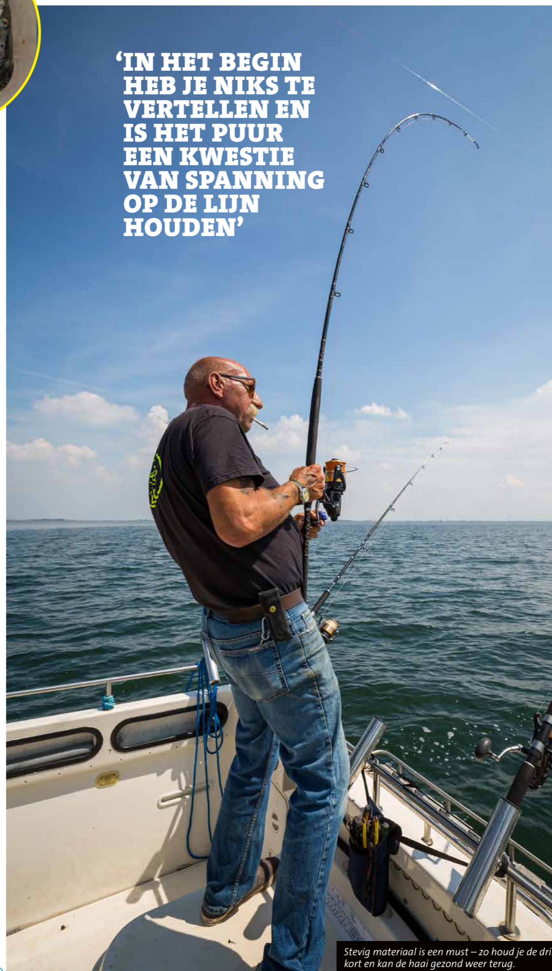
Stevig materiaal is een must – zo houd je de dril kort en kan de haai gezond weer terug.

'IN HET BEGIN HEB JE NIKS TE VERTELLEN EN IS HET PUUR EEN KWESTIE VAN SPANNING OP DE LIJN HOUDEN'