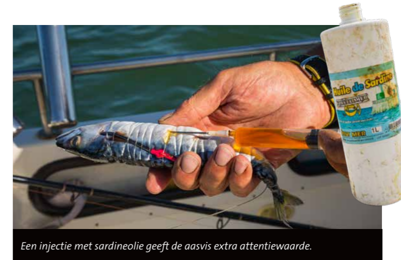
Een injectie met sardineolie geeft de aasvis extra attentiewaarde.

Ook de klappen die even later op dezelfde hengel te zien zijn, leiden helaas niet tot een run. "Maar ze zitten er wel degelijk", grijnst Peer als hij vervolgens een stukgebeten makreel binnendraait.