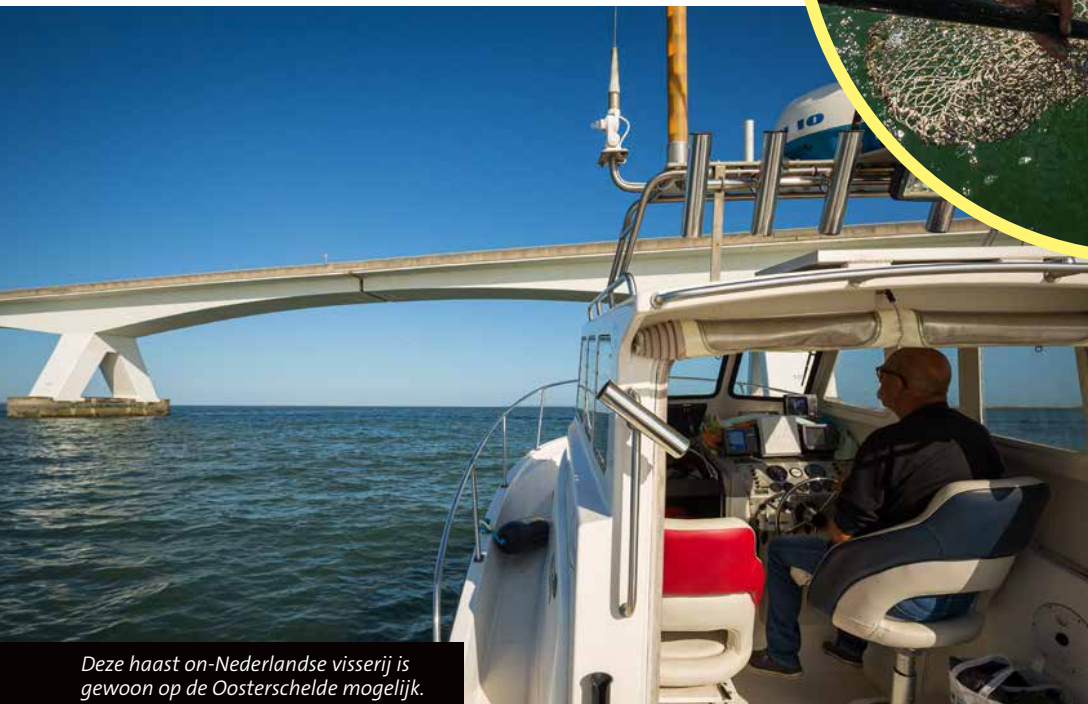
Deze haast on-Nederlandse visserij is gewoon op de Oosterschelde mogelijk.

niet helemaal afmatten. Hij moet immers ook weer gezond en wel terug het water in.”