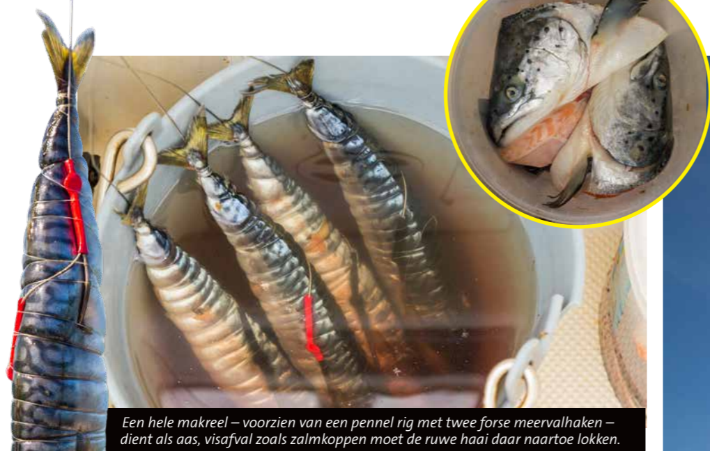
Een hele makreel – voorzien van een pennel rig met twee forse meervalhaken – dient als aas, visafval zoals zalmkoppen moet de ruwe haai daar naartoe lokken.

D e zwarte emmer waarin vier keurig met bindelastiek ingesnoerde dode makrelen klaarliggen – ieder exemplaar is voorzien van een pennel rig met twee forse meervalhaken en een stuk stevig staaldraad – doet haast vermoeden dat we dit keer op een tropische locatie achter grote en rooflustige vis aan gaan. Dat klopt maar ten dele. Uiteraard zijn ruwe haaien van ruim anderhalve meter en zo'n dertig kilo zeer respectabele roofvissen. Deze grote hondshaaien bevissen we echter niet in een azuurblauwe oceaan, maar 'gewoon' op onze eigen oer-Hollandse Oosterschelde.