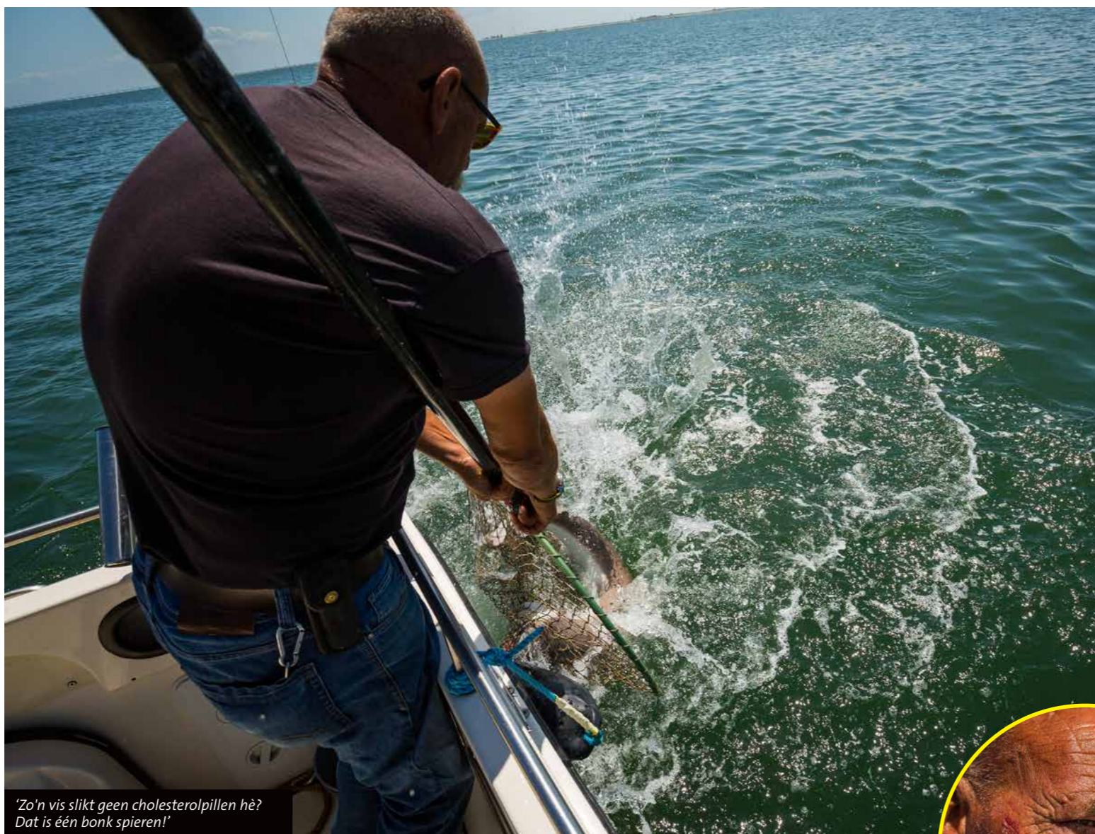
'Zo'n vis slikt geen cholesterolpillen hè? Dat is één bonk spieren!'

Nog een tip: kweek tevens wat zitvlees. Inmiddels zijn de nodige uren verstreken, maar hebben we nog geen teken van leven gezien. Terwijl Peer toch aardig wat trucs uit de hoge hoed heeft gehaald. Zo is