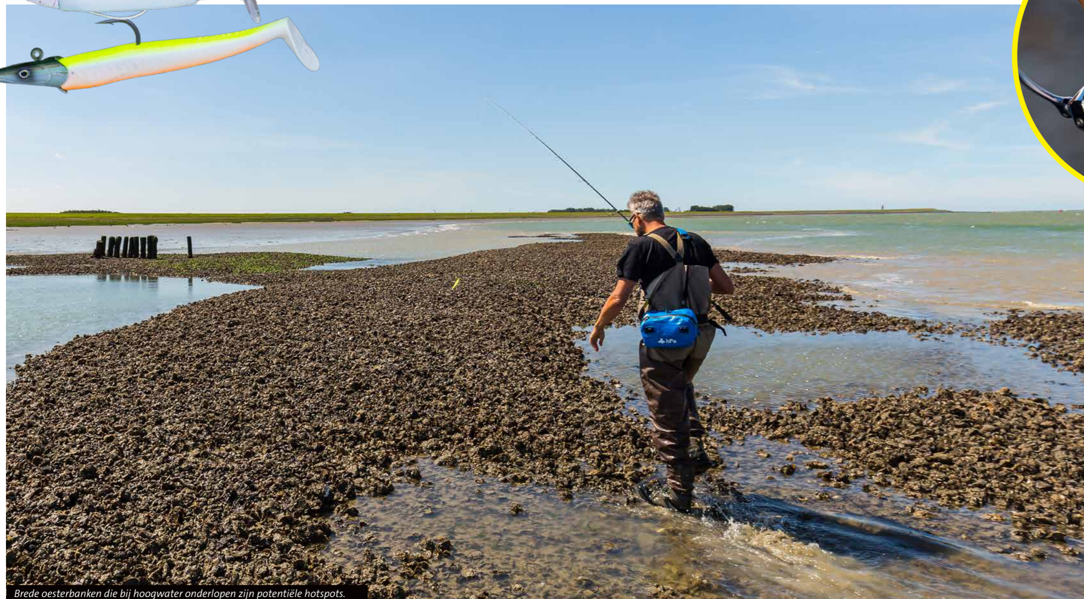
Brede oesterbanken die bij hoogwater onderlopen zijn potentiële hotspots.