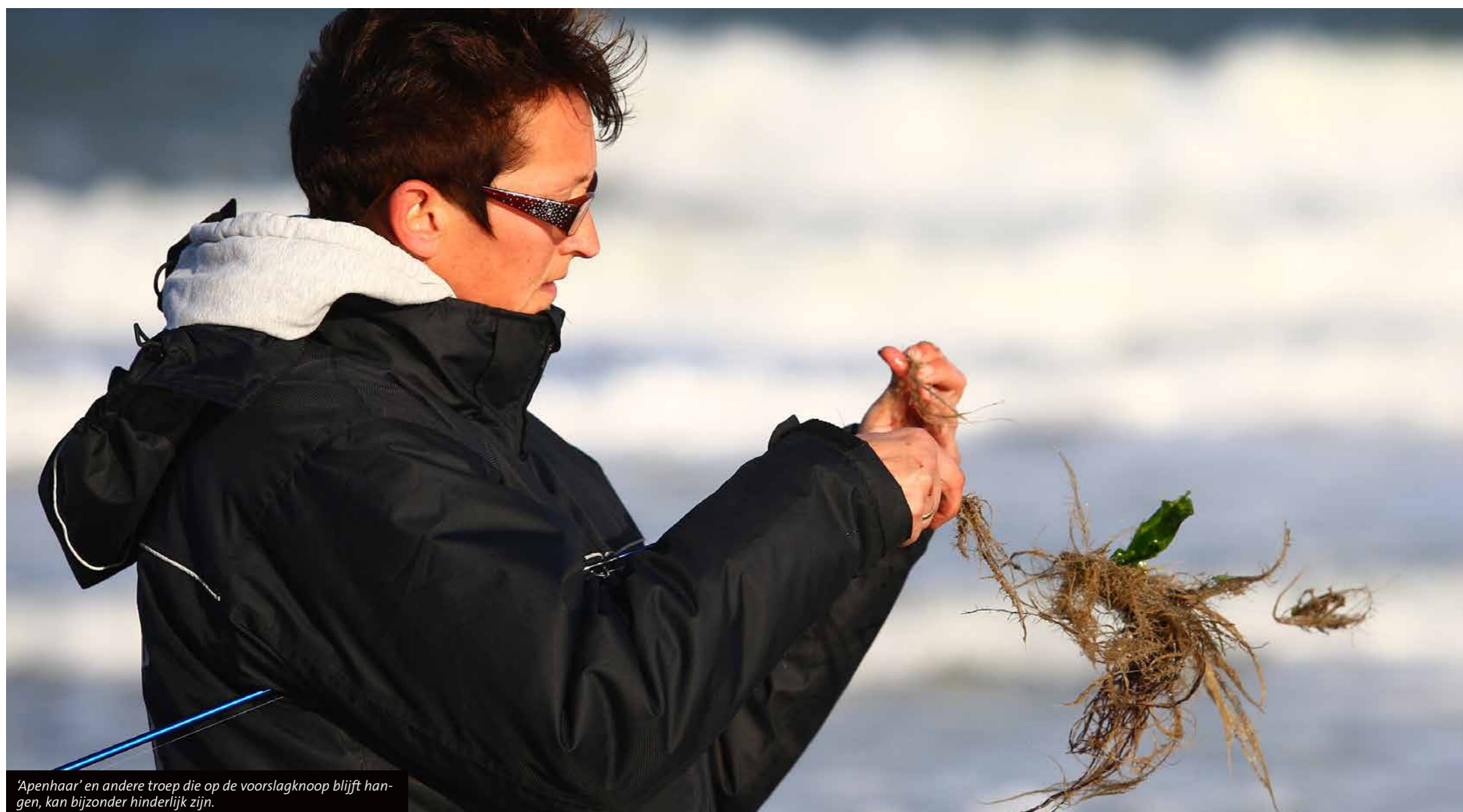
'Apenhaar' en andere troep die op de voorslagknoop blijft hangen, kan bijzonder hinderlijk zijn.