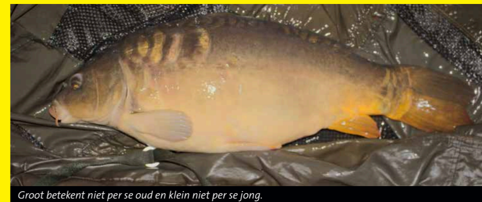
Groot betekent niet per se oud en klein niet per se jong.

7.100 gram is het formaat bescheiden. Het is een gave vis, zonder littekens. De schubben zien er bijna als nieuw uit en zowel lengte als gewicht wijzen op een vrij jonge karpers. Maar schijn bedriegt. Deze Valkenswaard-spiegelkarp werd gematcht als een vis die als twee- of driejarige karpers op 30 september 1998 in Amsterdam werd uitgezet! Deze jong ogende vis was bij deze vangst dus al 23 jaar oud! Leuke weetjes die je er gratis bij krijgt als je een projectspiegel meldt bij een SKP.