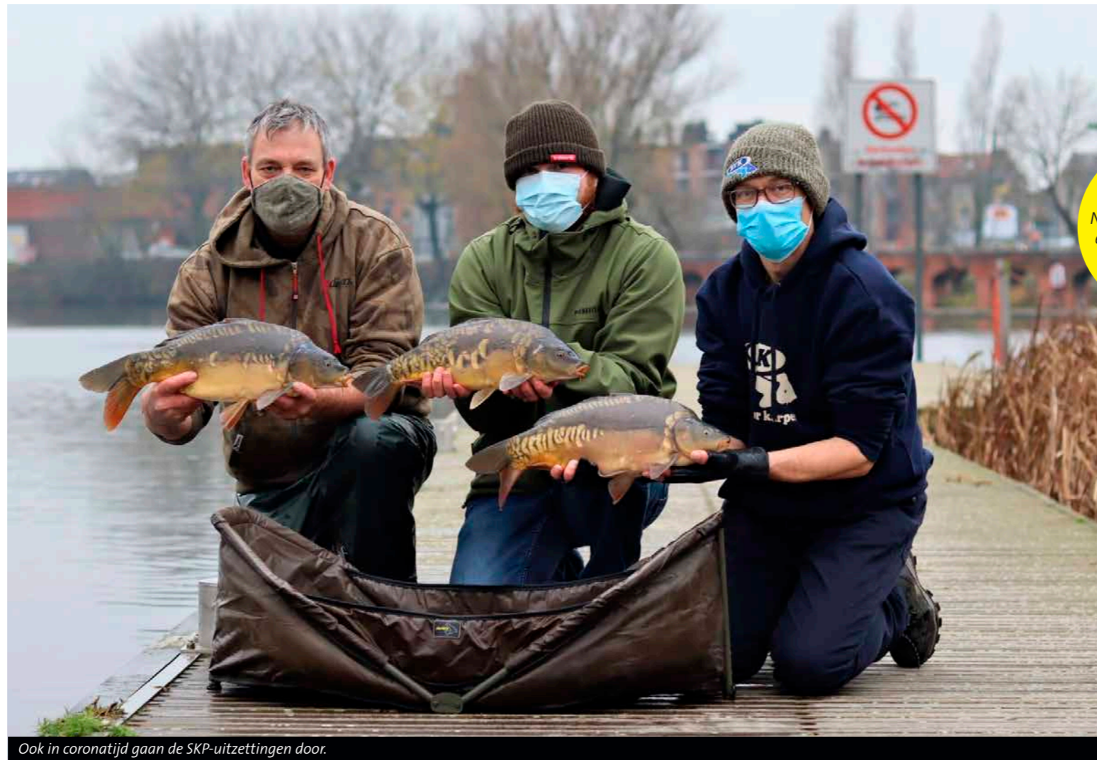
Ook in coronatijd gaan de SKP-uitzettingen door.

H et concept van een SKP is even simpel als doeltreffend. Voor je spiegelkarpers uitzet, maak je van elke vis een close-up foto van de linkerflank. Vervolgens is die karpers zijn gehele verdere leven te herkennen (en te volgen) aan zijn unieke schubbenpatroon. Dit kan alleen dankzij de hulp van karpervissers die de moeite nemen om van een gevangen spiegelkarper een foto te maken (van de linkerflank) en die te melden bij een SKP in die regio. Deze wijze van monitoring – met een sjiek woord: citizen science – is springlevend en wordt grotendeels gedreven door de nieuwsgierigheid. Vooral als je een karper uitzet in een groot, open waterstelsel, prikkelt dat de fantasie waar de vis heen kan. Je wilt dan graag weten hoe het zo'n karper op den duur vergaat.