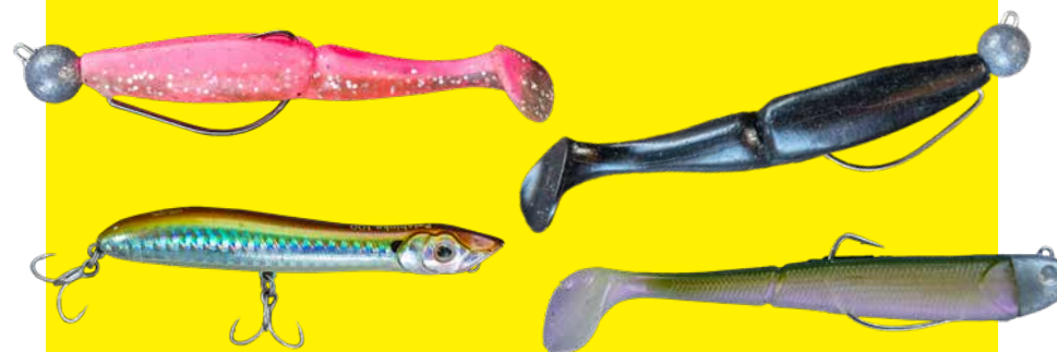
Kies bij helder water voor meer natuurlijke kleuren (ayu en sardine) en in troebel water voor fellere of contrastrijke kleuren (wit, chartreuse, roze en zwart)

tot ik contact voel met de bodem. Vanaf dat moment versnel ik het binnendraaien om de shad mooi boven de bodem te houden. Zo krijg je de snoeiharde aanbeten die dit spelletje zo machtig mooi maken. Je kunt nog op tal van andere manieren zeebaars vangen vanuit de kajak. Bijvoorbeeld met een dropshotmontage, een techniek die ook heel erg effectief is – niet alleen met kunststaas, maar ook met een zager. Driftend of stil hangend op één plek werpend vissen werkt ook prima. Neem dus zeker ook wat hardbaits mee, zowel duikende- als oppervlaktepluggen.