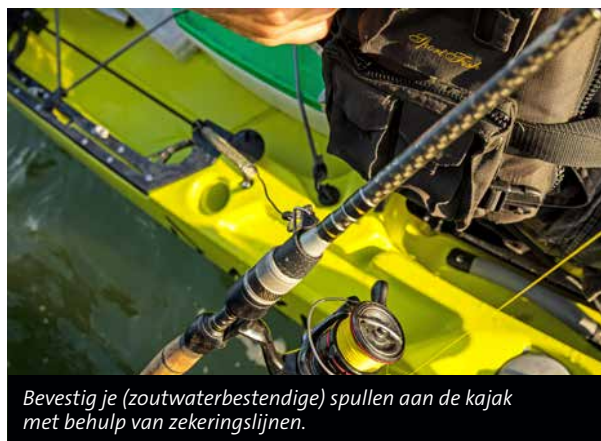
Bevestig je (zoutwaterbestendige) spullen aan de kajak met behulp van zekeringslijnen.