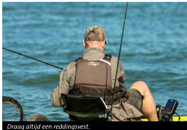
Draag altijd een reddingsvest.

Als je met de kajak het water op gaat, staat veiligheid altijd met stip op één – zeker op een drukbevaren water als de Westerschelde. Zorg dus dat je de verkeersregels op het water kent en veilig te werk gaat. Draag om te beginnen dus altijd een reddingsvest. Let daarbij vooral op het comfort en het drijfvermogen van het vest. Dit gaat namelijk je leven redden als je onverhoopt uit de kajak valt. Je kunt eventueel een zekeringstouw tussen jou en de kajak bevestigen – zoals surfers ook doen met hun plank – maar dan moet je wel 100% zeker weten dat je kajak niet zinkt. Kies bij voorkeur ook voor een kajak met een opvallende kleur, zodat je optimaal zichtbaar bent. Zorg er ook voor dat je weet hoe stabiel jouw vaartuig is. Test dit uit op een ondiep binnenwater. Ga rechtop staan, kruip even rond, voer zoveel mogelijk denkbare manoeuvres uit zodat je weet waar de grenzen van je bewegingsvrijheid liggen. Maak ook altijd een plan voordat je het water opgaat. Kijk naar de omstandigheden (zoals het getij en weer) en bepaal mede op basis daarvan hoe je de sessie indeelt. Dit heeft als extra voordeel dat je minder, maar meer uitgelezen materiaal aan boord hebt en je vangansen worden vergroot. Laat tenslotte het thuisfront weten waar je gaat vissen en zorg voor een opgeladen mobiele telefoon die je in een watterdichte zak meeneemt.