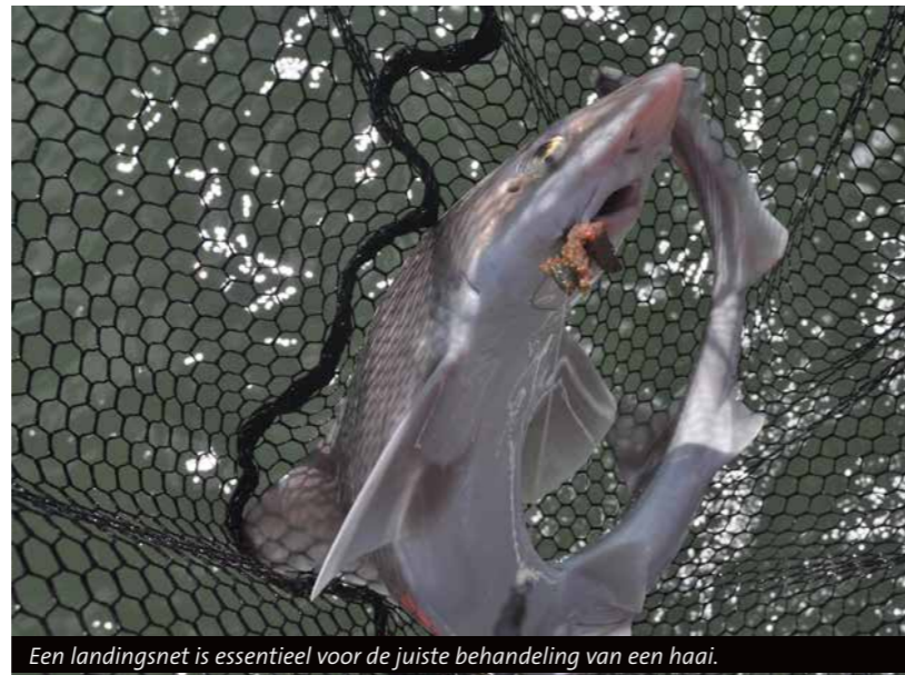
Een landingsnet is essentieel voor de juiste behandeling van een haai.

Ondanks de typische haaienlook is de gladde haai een ongevaarlijke soort voor de mens. Dit type haai voedt zich voornamelijk met zwemkrabben, garnalen en kreeftachtigen. Vis maakt geen belangrijk deel uit van het dieet, wat duidelijk te zien is aan het gebit. In plaats van de gebruikelijke vlijmscherpe haaiantanden heeft de gladde haai meer stompe, platte maaltanden waarmee ze hun voedsel malen. Vanwege het ontbreken van 'echte' tanden wordt de gladde haai in Groot-Brittannië ook wel gummy shark genoemd. Vang je een ruwe haai, dan is het wel oppassen. Deze viseters hebben een akelig scherp gebit en deinzen er niet voor terug om naar je te happen.