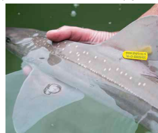
Onderzoek met gemerkte haaien heeft aangetoond dat zij de vangst door een sportvisser prima overleven, mits ze op de juiste wijze worden gehanteerd.

Ondanks hun ruige uiterlijk zijn haaien kwetsbare dieren waar je voorzichtig mee om dient te gaan. Ze hebben immers geen ribben die hun organen beschermen. Het skelet van deze vissen bestaat bovendien niet uit bot, maar is gemaakt van kraakbeen. De waterdruk zorgt ervoor dat hun lichaam vorm behoudt, maar buiten het water hangt de boel er als het ware een beetje bij. Dit komt omdat het lichaam van de vis zijn gewicht niet kan dragen. Het is daarom belangrijk de haai altijd goed horizontaal te ondersteunen – een hand bij de staart, de andere hand onder zijn buik – zodat er niet te veel druk op de organen komt te staan. Til een haai dus nooit op aan de haak, zijn kieuwen of de staart. Dit kan er namelijk voor zorgen dat organen loskomen, schade wordt veroorzaakt aan de rugengraat en tot sterfte leiden