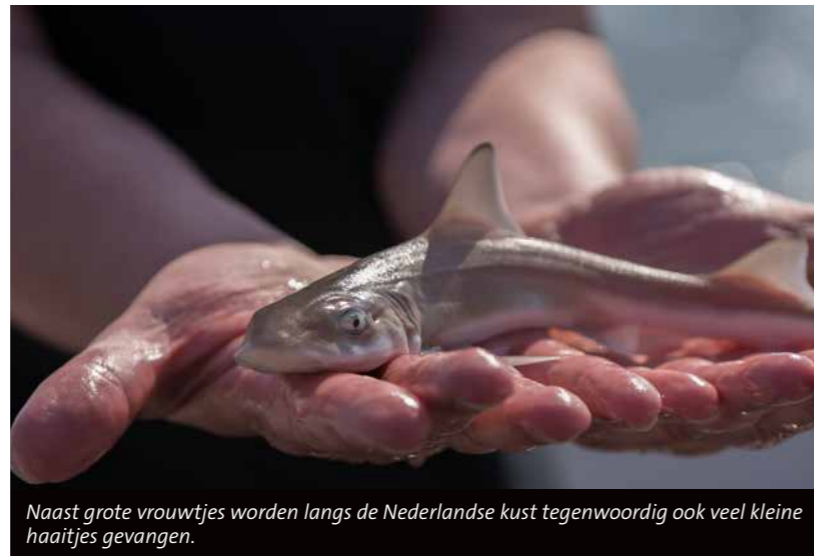
Naast grote vrouwtjes worden langs de Nederlandse kust tegenwoordig ook veel kleine haaitjes gevangen.