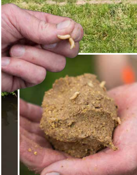
Het kant-en-klare voertje wordt aangelengd met maden en löss.