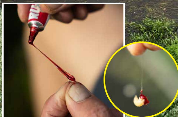
Als Alphons al een trucje toepast, is het meestal Rubiver.