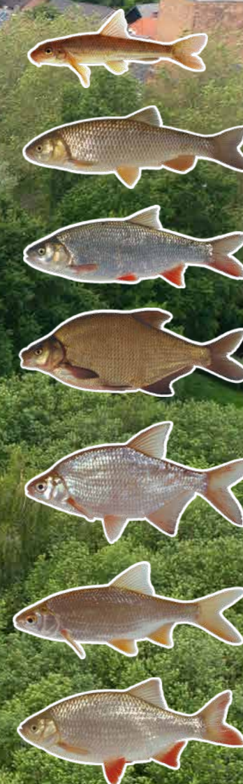
De variëteit aan soorten is groot in de Dommel.

Het driftend vissen blijkt ook vandaag weer prima te werken. Grote kolbleien, prachtige 'ruisers', blankvoorns en riviergrondels komen geregeld boven water. "Je kunt weinig fout doen met deze visserij, de