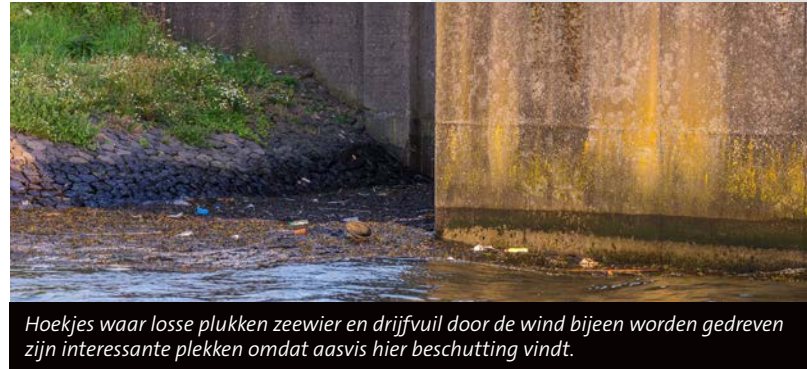
Hoekjes waar losse plukken zeewier en drijfvuil door de wind bijeen worden gedreven zijn interessante plekken omdat aasvis hier beschutting vindt.

“ N ormaal gesproken vissen we veelal met kunstaas op het binnenwater. Maar dit is nu al een leuk uitstapje naar het zoute”, zegt Orhan bij aankomst op de stek. In het westen zakt de zon langzaam al ietsje richting de horizon, daarbij het industriële landschap van de IJmond in een zachte, oranje gloed dompelend. “Voor het mooie zijn we nu – in het daglicht – nog aan de vroege kant, maar dan zijn we er welhaast zeker van dat we straks kunnen vissen waar we dat graag willen.” In een hoek van het uitgestrekte sluisencomplex moet het gaan gebeuren. “Zie je die plakken losgeslagen zeewier drijven?”, wijst zijn metgezel Rik richting het water. “Daar kan visbroed en ander klein spul zich mooi onder verstoppen. Dat weet de horsmakreel ook, dus die komt hier in de schemering vermoedelijk wel even een kijkje nemen”, zegt hij hoopvol. Voordat het zover is, zoomen we in op de diverse aspecten van de Aji visserij.