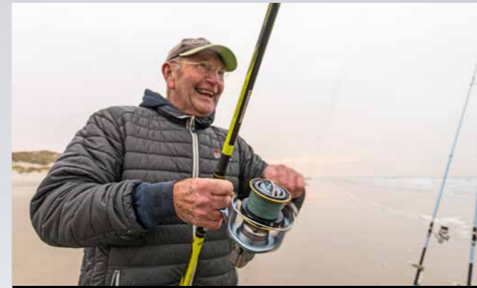
De juiste hengel zorgt voor meer visplezier.

Strandhengels van een beetje kwaliteit zijn er van zo'n € 150,- tot net onder de € 1.000,-. Voor aanschaf moet je bij jezelf te rade gaan wat het je waard is. Ga je tot tien keer per jaar lekker recreatief vissen? Dan pak je een hengel uit een andere prijsklasse dan de wedstrijdvisser die 40 tot 50 (internationale) wedstrijden per jaar op topniveau vist en state of the art hengels wil hebben. Houd daarbij in het achterhoofd dat goedkopere hengels per definitie van kwalitatief minder hoogwaardige materialen zijn gemaakt – een top set ogen van titanium met een torzite voering kost al tussen de 150 en 200 euro, dus die zitten niet op een hengel van € 250,-. Met geleide-ogen van marktleider Fuji – herkenbaar aan de merknaam in de pootjes van het oog – zit je altijd goed; wat eveneens geldt voor reelhouders van dit merk. Pacbay, Seymo en Alps zijn ook topmerken als het om ogen en reelhouders gaat. Zorg tenslotte goed voor je spullen en spoel die na iedere sessie af. De hengel die 100% zoutwaterbestendig is moet nog worden gemaakt.