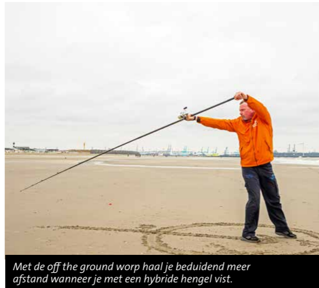
Met de off the ground worp haal je beduidend meer afstand wanneer je met een hybride hengel vist.

Waar de lange dikke backcast hengels, de korte tapse pendulum hengels en de zware 5 meter hengels allemaal om een specifieke werptechniek vroegen, zijn de moderne hybride hengels veel meer allround. Het verdient echter wel de aanbeveling om de off the ground worp onder de knie te krijgen – daar haal je met deze hengel echt aanzienlijk meer afstand mee dan met een overhead worp. Dit vanwege het feit dat de oorsprong van de hybride hengels in Spanje ligt. Daar heb je in de Middellandse Zee geen of nauwelijks getijdenwerking en wordt er dus niet geankerd gevist. Om werpgewichten zonder ankers zover mogelijk weg te kunnen zetten, gebruiken ze daar de off the ground worp. Dit is de reden dat deze hengel op dit type werpstijl is aangepast. Dat dit perfect werkt zag ik in 2021 tijdens het WK Korpsen in Albufeira waar de Spaanse ploegen de scepter zwaaiden met fantastisch snelle 270 graden worpen met 4.25 meter lange hengels en slechts 140 gram maximaal werpgewicht.