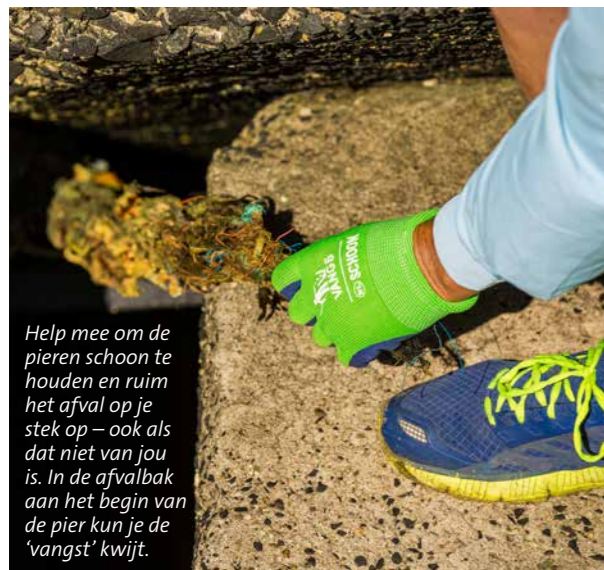
Help mee om de pieren schoon te houden en ruim het afval op je stek op – ook als dat niet van jou is. In de afvalbak aan het begin van de pier kun je de 'vangst' kwijt.