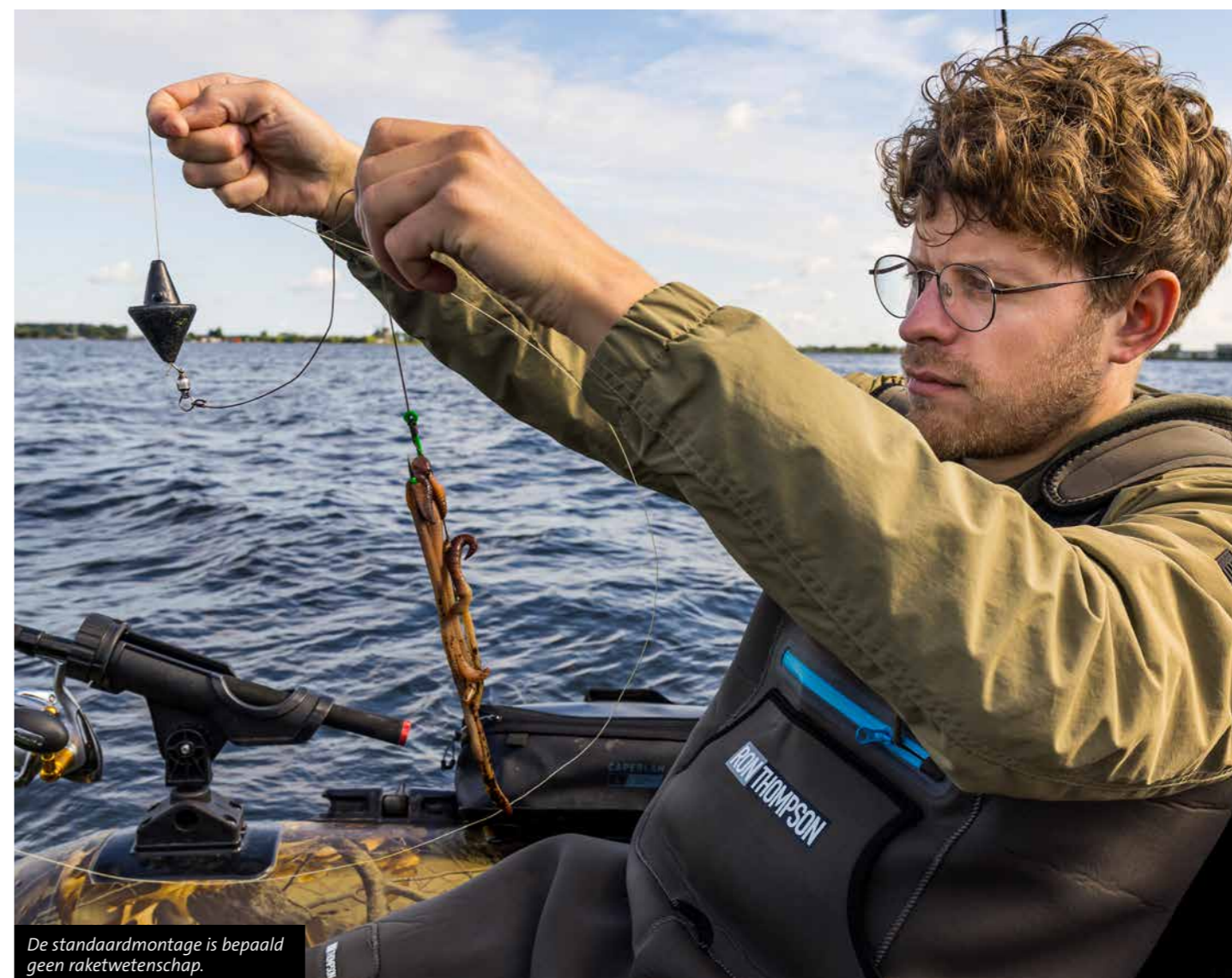
De standaardmontage is bepaald geen raketwetenschap.

Vang je op de Braassemermeer of elders in het werkgebied van Hoogheemraadschap Rijnland meerval, meld deze dan via www.meervalmeldpunt.nl . Zo help je mee aan onderzoek én ontvang je een MijnVISmaat meetlint XL.