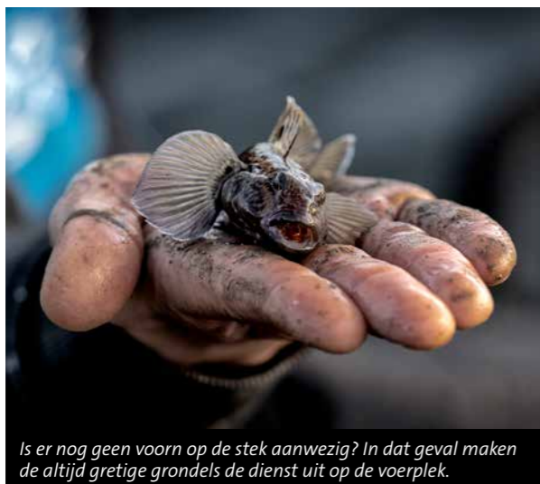
Is er nog geen voorn op de stek aanwezig? In dat geval maken de altijd gretige grondels de dienst uit op de voerplek.

de bodem komt te liggen. "Het gevolg is dat de beetindicatie minder gevoelig wordt. Dan dien je de dobber een stukje naar beneden te schuiven. Houd er ook rekening mee dat er bij een stijgend waterpeil nog voldoende lijn plat op de bodem ligt. Zo niet, schuif de dobber dan een