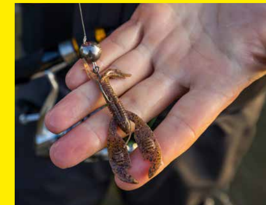
Een drijvende kreeftimitatie gevestigd aan de Cheburaska-rig komt op de bodem bij stilstand mooi rechtop te staan en kan optimaal bewegen.

Tegenwoordig zijn er tal van technieken waarmee je succesvol op grote baarzen kunt vissen. De twitchbait en Cheburaska-rig zijn twee voorbeelden van mooie alternatieven voor de ‘standaard’ jigkop-shad-combinatie.