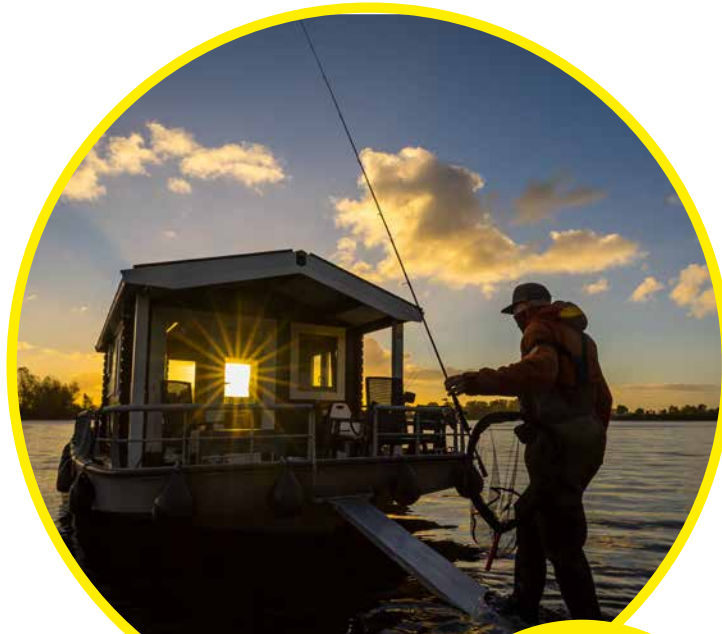
Via de kaart op fishinginholland.nl vind je tal van toffe sportvisaccommodaties; waaronder deze blokhutboot.

Werp – zéker in de schemering – altijd eerst de oeverzone uit alvorens je gaat waden