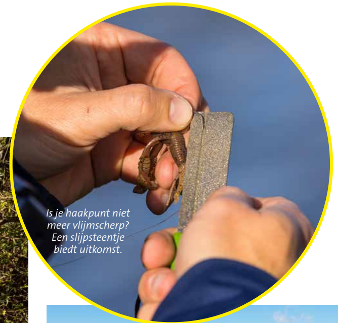
Is je haakpunt niet meer vlijmscherp? Een slijpsteentje biedt uitkomst.