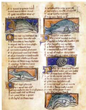
Folio uit een 13e-eeuws handschrift van Jacob van Maerlant Der naturen bloeme , een encyclopedisch werk waarin hij onder meer allerlei vissoorten en zeewezens bespreekt.

Een van de zaken waarover Coenen zijn lezers zeer beeldend inlicht, is de smaakvoorkeur van de zestiende-eeuwse Hollandse visconsument. Het zal niet verbazen dat haring favoriet was. Ook toen al at men de haring rauw, licht gepeld en met een gesnipperd uitje erbij. Hoezeer de Hollander aan zijn haring hing, wordt duidelijk uit het verhaal