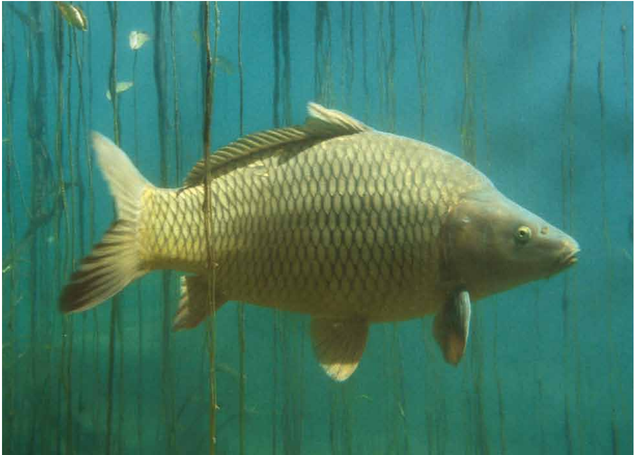
Karpers hadden vroeger een status als consumptievis.