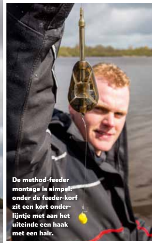
De method-feeder montage is simpel: onder de feeder-korf zit een kort onderlijntje met aan het uiteinde een haak met een hair.