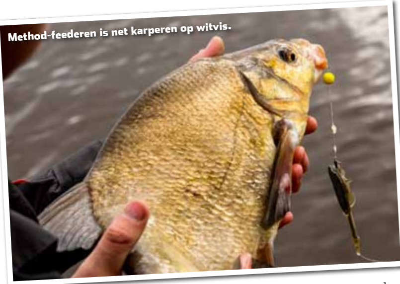
Method-feederen is net karpere op witvis.