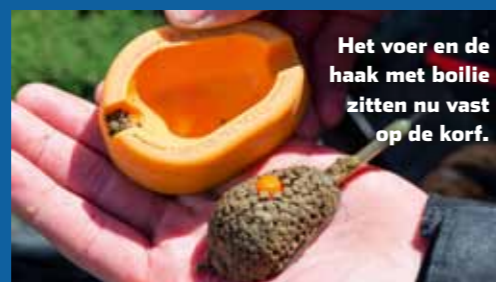
Het voer en de haak met boilie zitten nu vast op de korf.

"Dat prik je in de boilie, waarna die keurig en vooral stevig onder de haak blijft hangen – ook tijdens de worp." De haak is aan een zeer kort onderlijntje van 15 cm lang en 20/00 diameter geknoopt, dat via een connector aan het elastiek van de voerkorf vast zit.