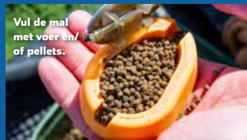
Vul de mal met voer en/of pellets.