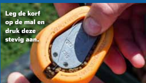
Leg de korf op de mal en druk deze stevig aan.