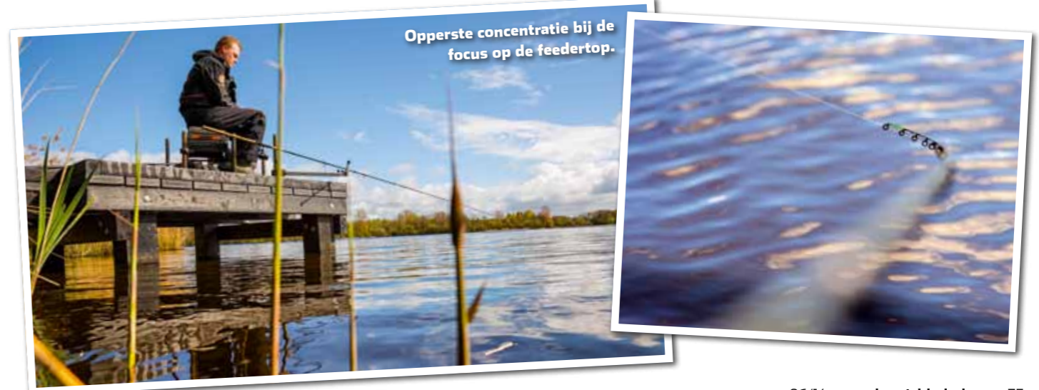
Opperste concentratie bij de focus op de feedertop.

Op het eerste gezicht lijkt de set up van Ramon op die van een typische feedervisser: zitkist met daarnaast een tafeltje voor het aas en andere benodigdheden, feedersteun, schepnet, etc. Maar in plaats van een 'feederkanon' voor de verre visserij – iets waar velen aan een groot water als de Kleine Wielen voor zouden kiezen – tovert hij een prachtige, lichte feederhengel (met