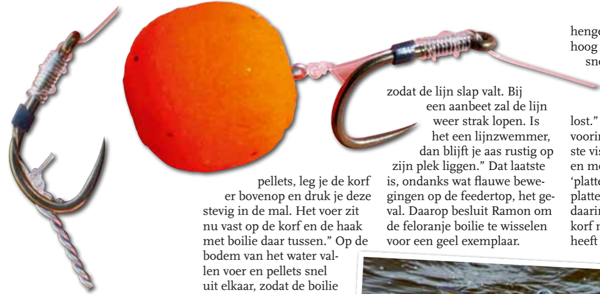
Een dun, metalen spiraaltje maakt een stopper om de boilie op de hair te houden overbodig.

zodat de lijn slap valt. Bij een aanbeet zal de lijn weer strak lopen. Is het een lijnzwemmer, dan blijft je aas rustig op zijn plek liggen." Dat laatste is, ondanks wat flauwe bewegingen op de feedertop, het geval. Daarop besluit Ramon om de feloranje boilie te wisselen voor een geel exemplaar.