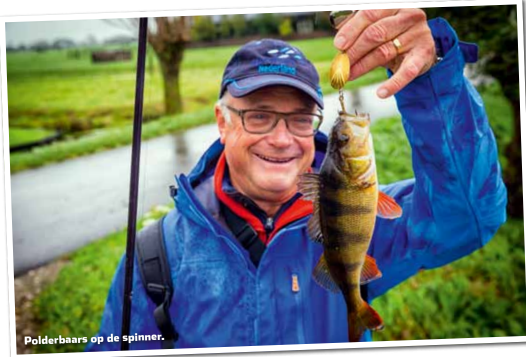
Polderbaars op de spinner.