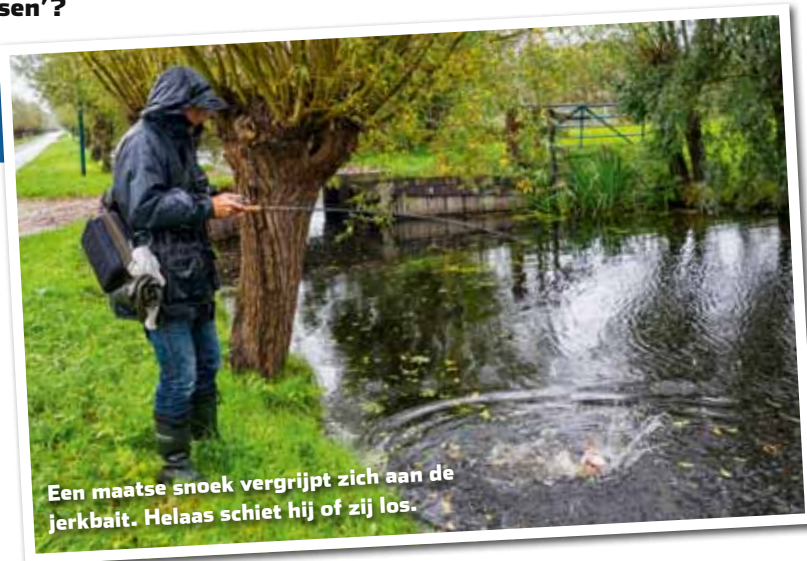
Een maatse snoek vergriipt zich aan de jerkbait. Helaas schiet hij of zij los.