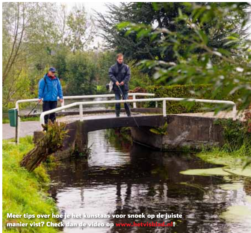
Meer tips over hoe je het kunstaas voor snoek op de juiste manier vist? Check dan de video op www.hetvisblad.nl !