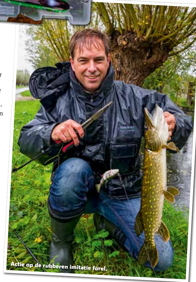
Actie op de rubberen imitatie forel.