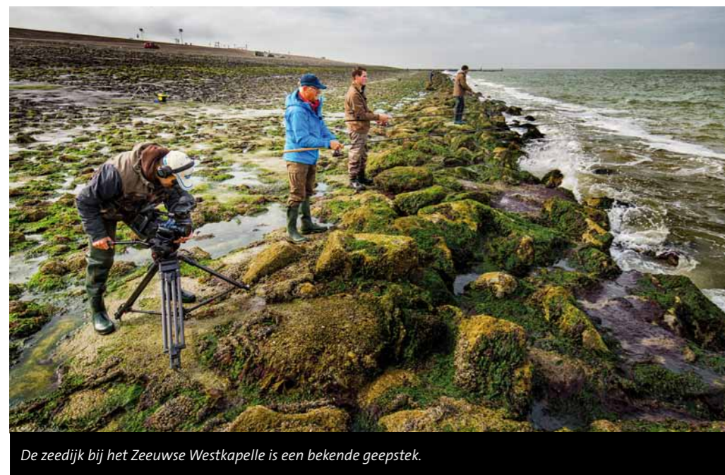
De zeedijk bij het Zeeuwse Westkapelle is een bekende geepstek.

maar een klein keelgat. Houd zo'n reepje vis daarom op maximaal 5 cm lengte en een halve cm breed. Voor de Zeeuwse wateren zijn kweekzagertjes echter het favoriete aas van de geepvissers. Prik de haak alleen door de kop van het zagertje en knijp vervolgens na ongeveer vijf