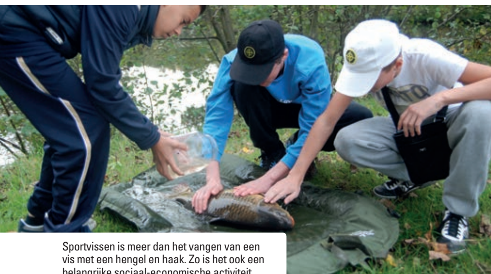
Sportvissen is meer dan het vangen van een vis met een hengel en haak. Zo is het ook een belangrijke sociaal-economische activiteit.