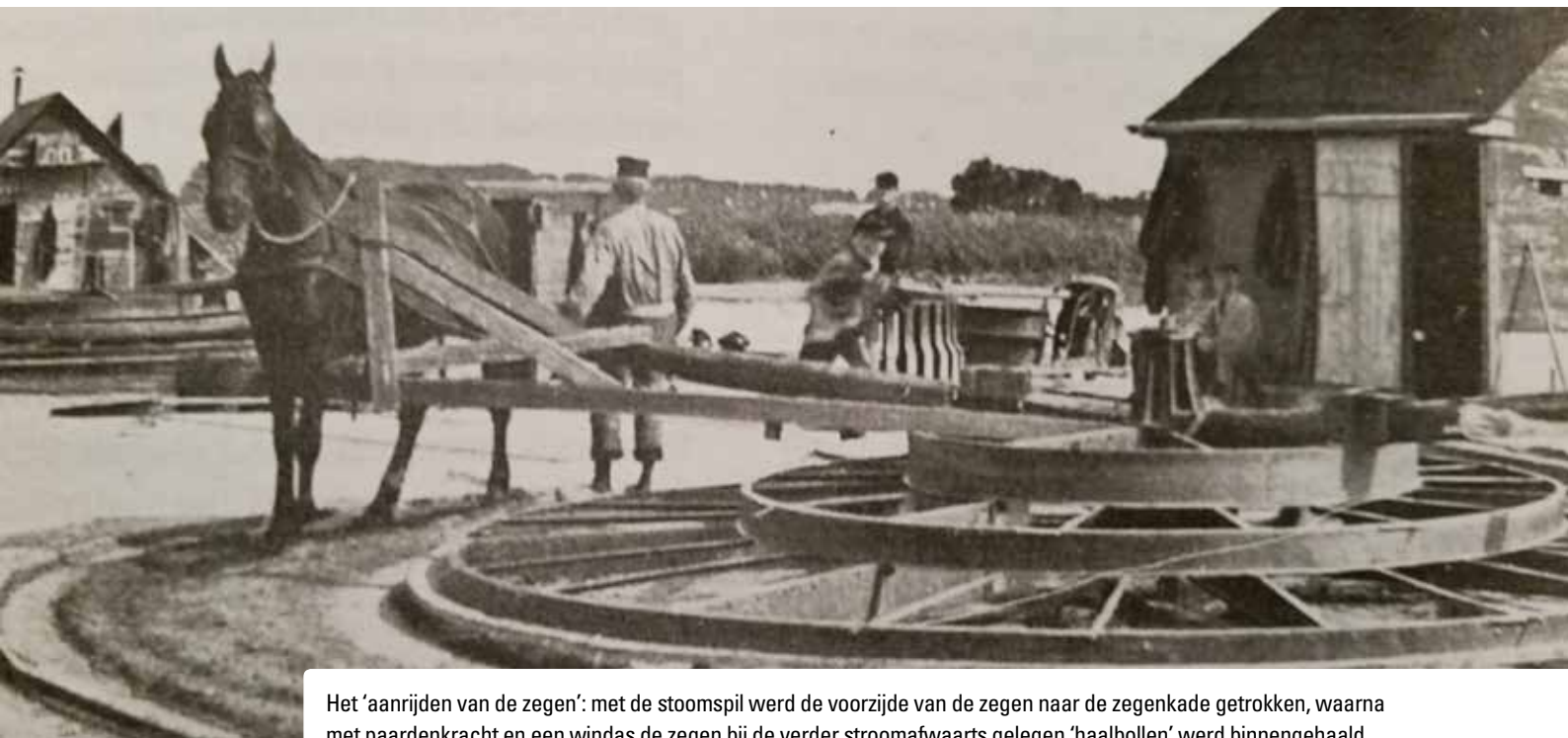
Het 'aanrijden van de zegen': met de stoomspil werd de voorzijde van de zegen naar de zegenkade getrokken, waarna met paardenkracht en een windas de zegen bij de verder stroomafwaarts gelegen 'haalbollen' werd binnengehaald.

voor de visstand, na watervervuiling, overbevissing, verlies en onbereikbaarheid van paaigronden.