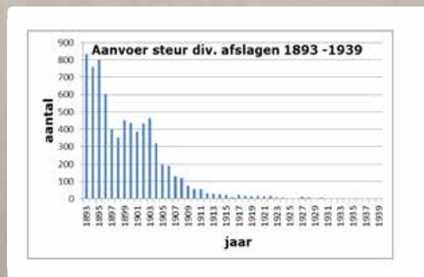
De afname van de Atlantische steur was dramatisch, dankzij het kierbesluit krijgt deze unieke vis weer een kans.