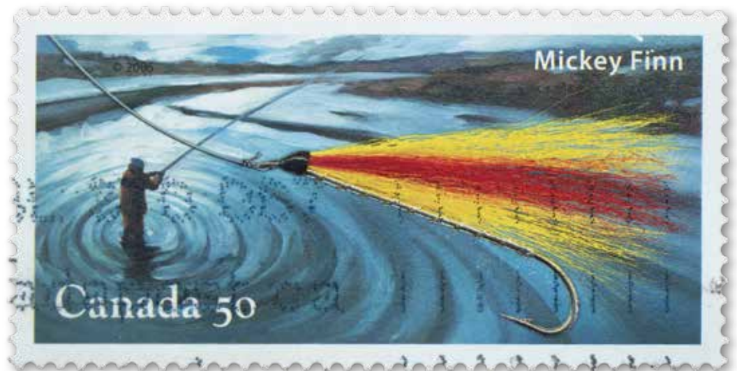
In een serie Canadese zegels staat de sportvisserij centraal.

De murene op een Cambodjaanse zegel blijkt een aal te zijn.