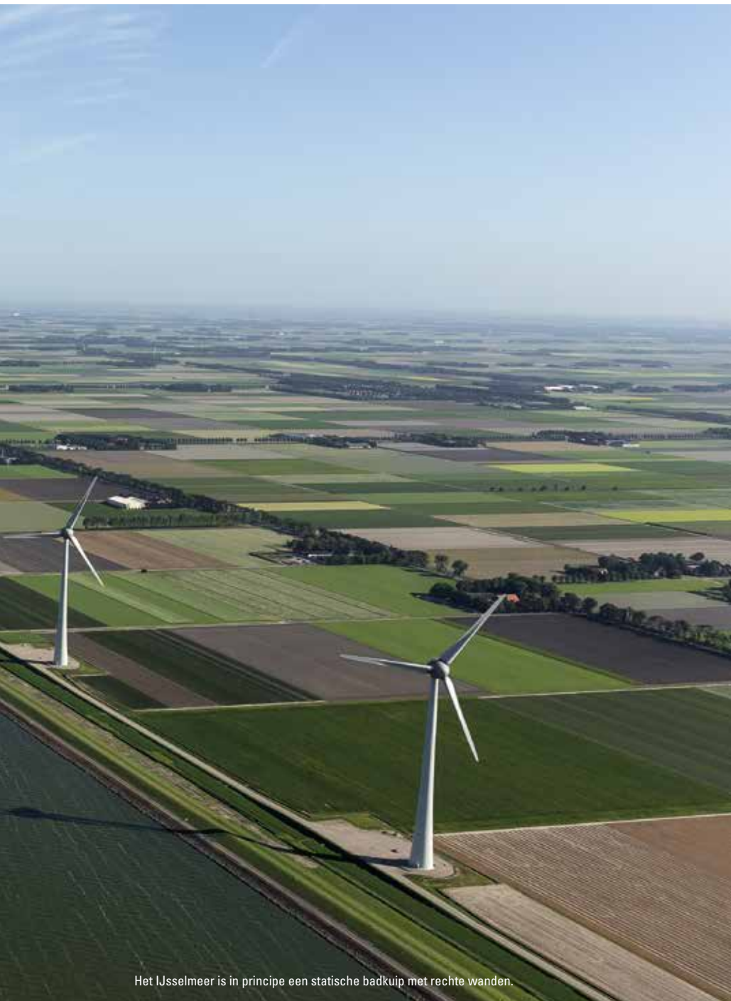
Het IJsselmeer is in principe een statische badkuip met rechte wanden.