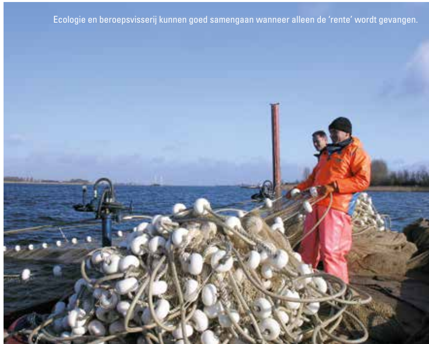
Ecologie en beroepvisserij kunnen goed samengaan wanneer alleen de 'rente' wordt gevangen.

Ook Weertman benadrukt dat de weg naar dit actieplan een bijzondere is geweest. "Dit was niet 'het zoveelste project'. Dit was echt een kwestie van vertrouwen winnen. De visserij heeft de afgelopen eeuw zware klappen gehad door onder meer de inpolderingen, het