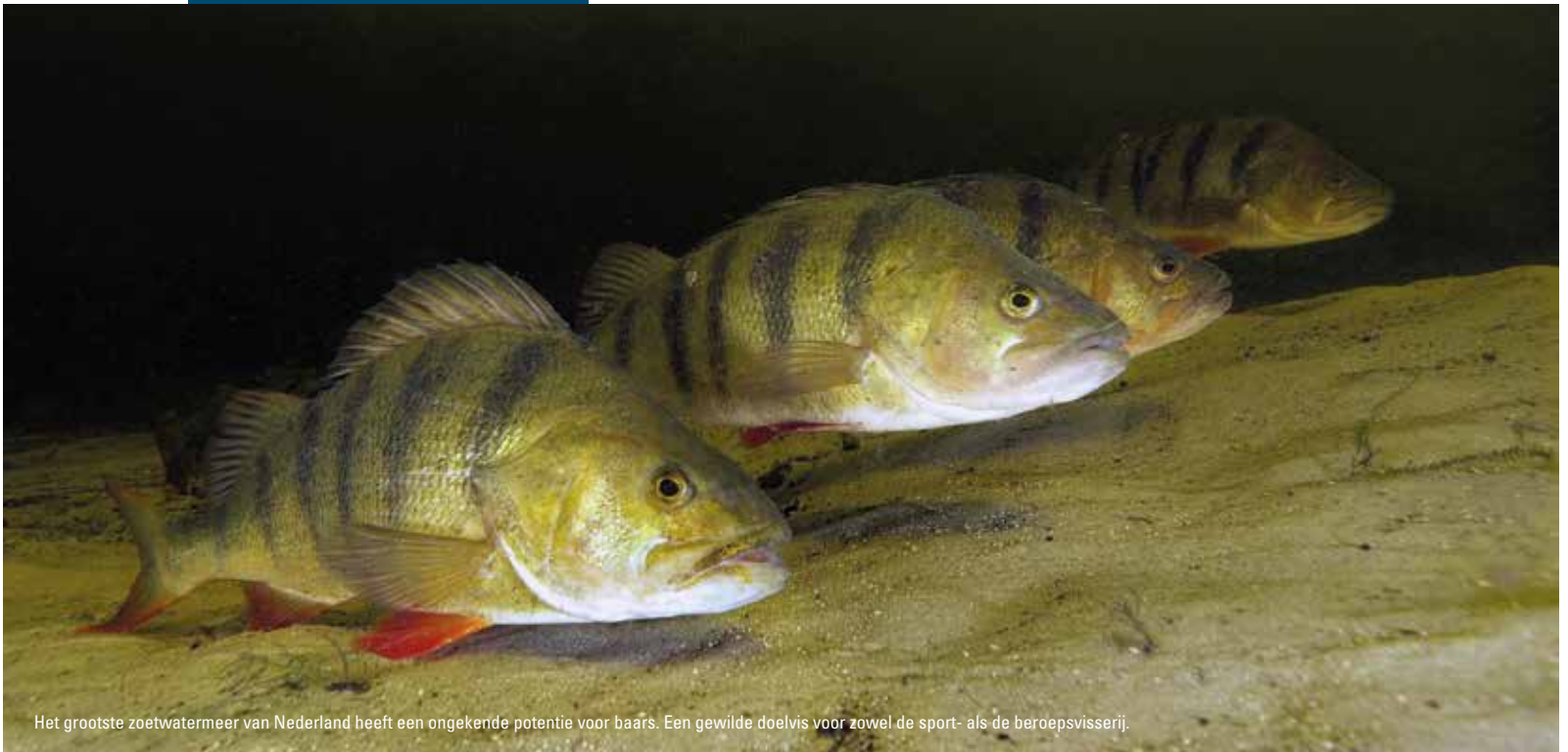
Het grootste zoetwatermeer van Nederland heeft een ongekennde potentie voor baars. Een gewilde doelvis voor zowel de sport- als de beroepvisserij.

“Als we nu vooruitkijken, is het een goede zaak dat iedereen hetzelfde doel voor ogen heeft, namelijk een rijker ecosysteem in het IJsselmeergebied.”