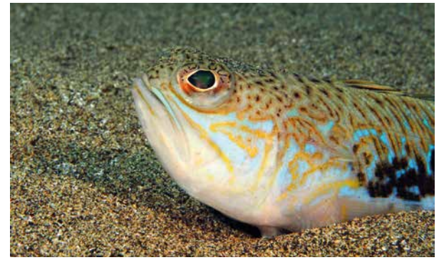
De grote pieterman werd vroeger zeedraak genoemd.

‘foutjes’ tussen”, vertelt ze. “Bijvoorbeeld schilderijen waarop fantasievissen staan of vissen uit de prehistorie, of een vismarkt zonder identificeerbare vissen. In boeken met visbeschrijvingen worden ook weleens meerminnen beschreven en deze staan soms ook op kunstwerken. Dat zijn natuurlijk fantasiefiguren, maar van sommige visachtige dieren zie je moeilijk of het om een bestaande soort gaat.” Deelnemers aan Zooniverse kunnen aangeven of ze een herkenbare vis op een afbeelding zien of niet. Als drie mensen geen herkenbare vis zien, wordt het kunstwerk uit de roulatie gehaald.”