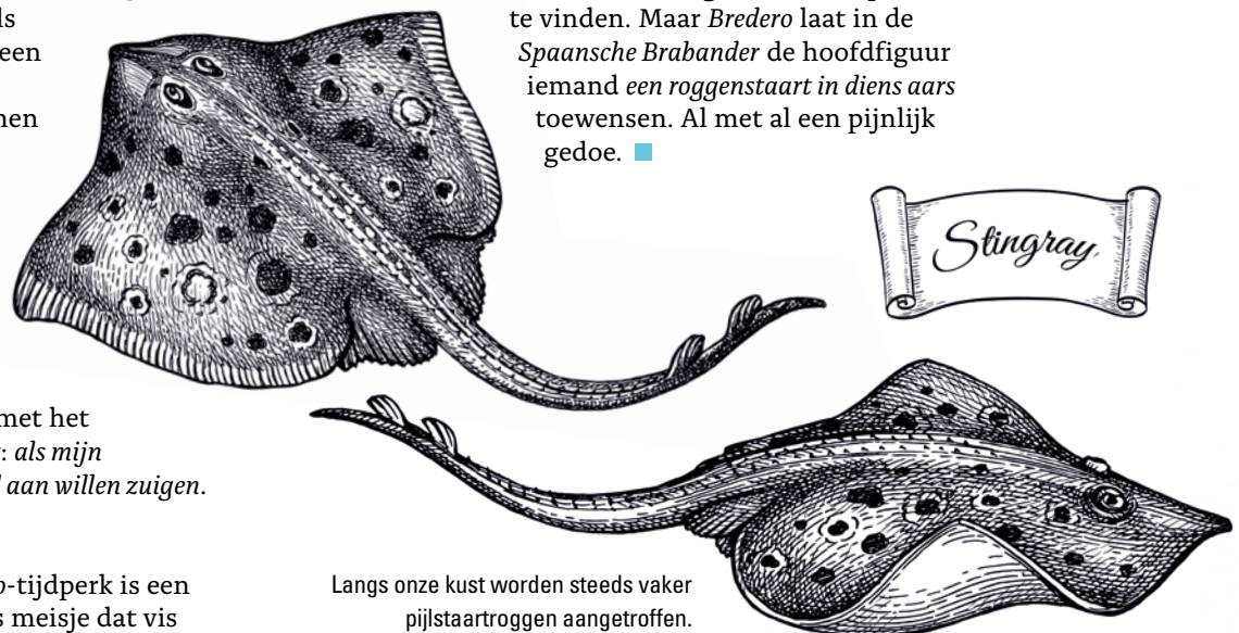
Langs onze kust worden steeds vaker pijlstaartroggen aangetroffen.

Een andere giftige vis die vaker te zien is in onze wateren is de pijlstaartrog , vroeger ook wel pielrog genoemd. Dit dier is bepaald niet aanvalslustig, maar zal zich bij dreiging wel met zijn giftige zweepstaart verdedigen. Het venijn zit hier dus daadwerkelijk in de staart. Het vervelende is dat die staart weerhaken heeft die een pijnlijke en rafelige wond kunnen veroorzaken. Ook hier is het gif warmtegevoelig en komt onze thermoskan weer van pas, hoewel langdurig spoelen onder een goede hete kraan nog beter is. Door de genoemde weerhaken en lange, priemende staart is het aantal dodelijke slachtoffers van pijlstaartroggen groter dan bij de pieterman. Zo heeft de populaire Australische presentator Steve Irwin een steek in de borst niet overleefd. In de vaderlandse literatuur zijn veel minder teksten over de rog dan over de pieterman te vinden. Maar Bredero laat in de Spaansche Brabander de hoofdfiguur iemand een rogenstaart in diens aars toewensen . Al met al een pijnlijk gedoe. ■