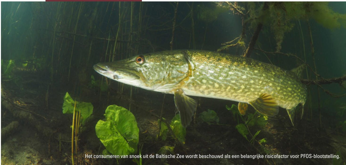
Het consumeren van snoek uit de Baltische Zee wordt beschouwd als een belangrijke risicofactor voor PFOS-blootstelling.

PFAS bij proefdieren kankerverwekkende eigenschappen geconstateerd. Toch is het lastig om te precies te voorspellen wat de gevolgen kunnen zijn van jarenlange consumptie van vervuilde zoetwatervis, zegt Teunen. “Risico’s worden altijd bepaald aan de hand van langdurige blootstelling: iemand die een keer een vis vangt en opeet, zal geen problemen krijgen maar bij vrijwel dagelijkse consumptie over meerdere jaren kunnen wél gezondheidsrisico’s ontstaan. In zoetwatervis zit bovendien vaak een mix van verschillende vervuilende stoffen. Daarom lijkt het mij niet verstandig om deze vissen te consumeren.”