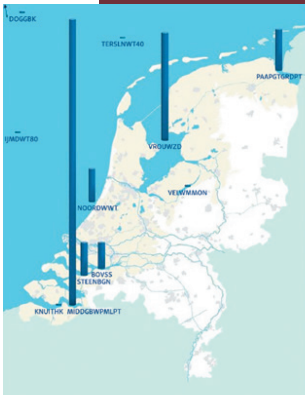
Relatieve weergaven van PFOS-concentraties in vis op elf locaties in 2019. Bot in de Westerschelde springt eruit; vis gevangen verder op de Noordzee bevat duidelijk lagere concentraties.

de Kaderrichtlijn Water. In ieder geval staan in mijn rapport de meetgegevens van blankvoorn, bot en schol.”