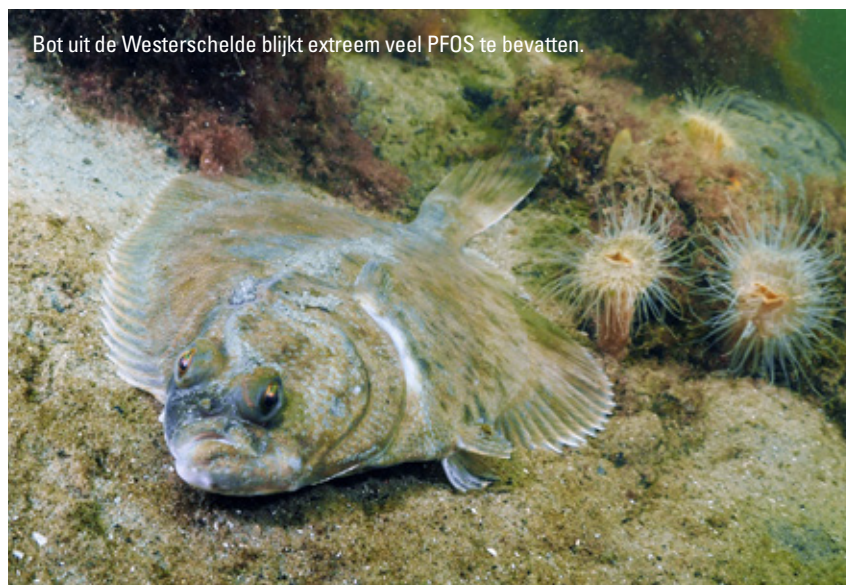
Bot uit de Westerschelde blijkt extreem veel PFOS te bevatten.

Bij het bepalen van de risico's van visconsumptie draait het om de inname: hoeveel gram zoetwatervis consumeert iemand in een jaar, hoeveel PFAS zit daarin en wat krijgt een persoon daarmee opgeteld binnen? Voor humane blootstelling aan PFAS gelden normen die zijn opgesteld door de Europese Autoriteit voor Voedselveilig-