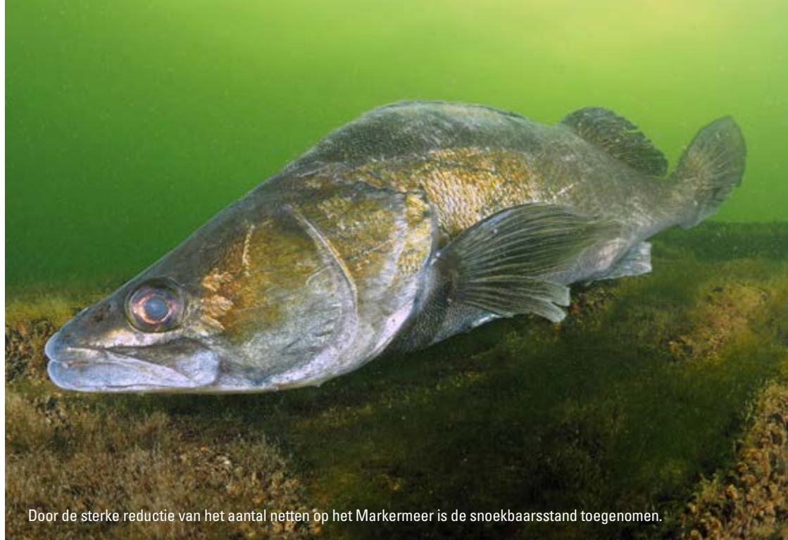
Door de sterke reductie van het aantal netten op het Markermeer is de snoekbaarsstand toegenomen.

"De meeste wateren in Nederland hebben een erg steile en abrupte overgang van land naar water", vervolgt hij. Het IJsselmeer is daar een extreem voorbeeld van: een badkuip zonder oevervegetatie. De waterbodem zou net als in Letland een meter per honderd meter moeten dalen. Als het waterpeil ook nog natuurlijk mag fluctueren – hoog in de winter, laag in de zomer – dan krijg je grote droogvallende vlaktes waar vegetatie zich kan ontwikkelen en die in het