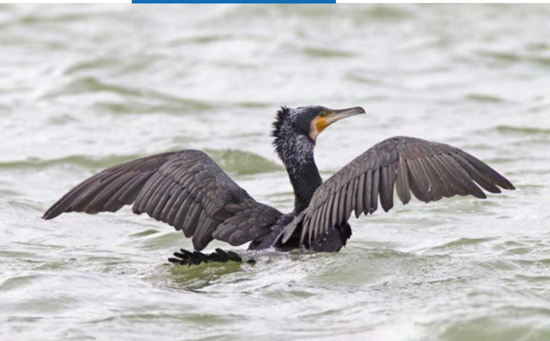
Predatie door aalscholvers kan een reden zijn voor de verstoorde populatieopbouw van vissen in het IJsselmeer.