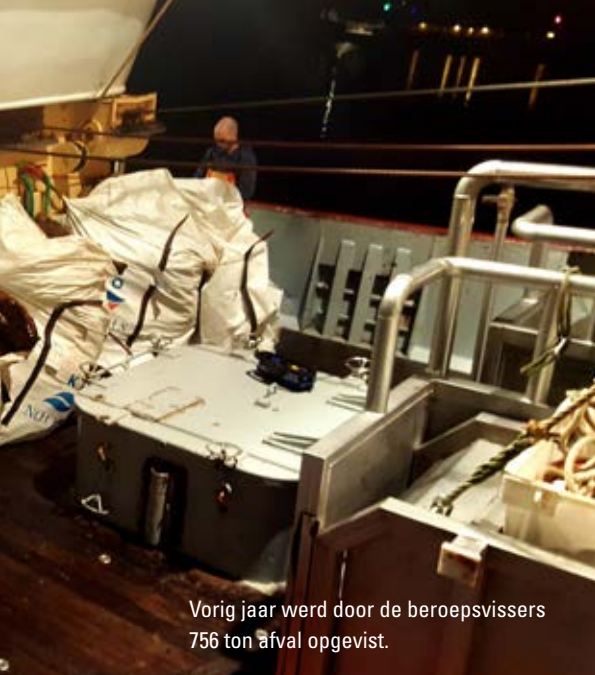
Vorig jaar werd door de beroepsvissers 756 ton afval opgevist.