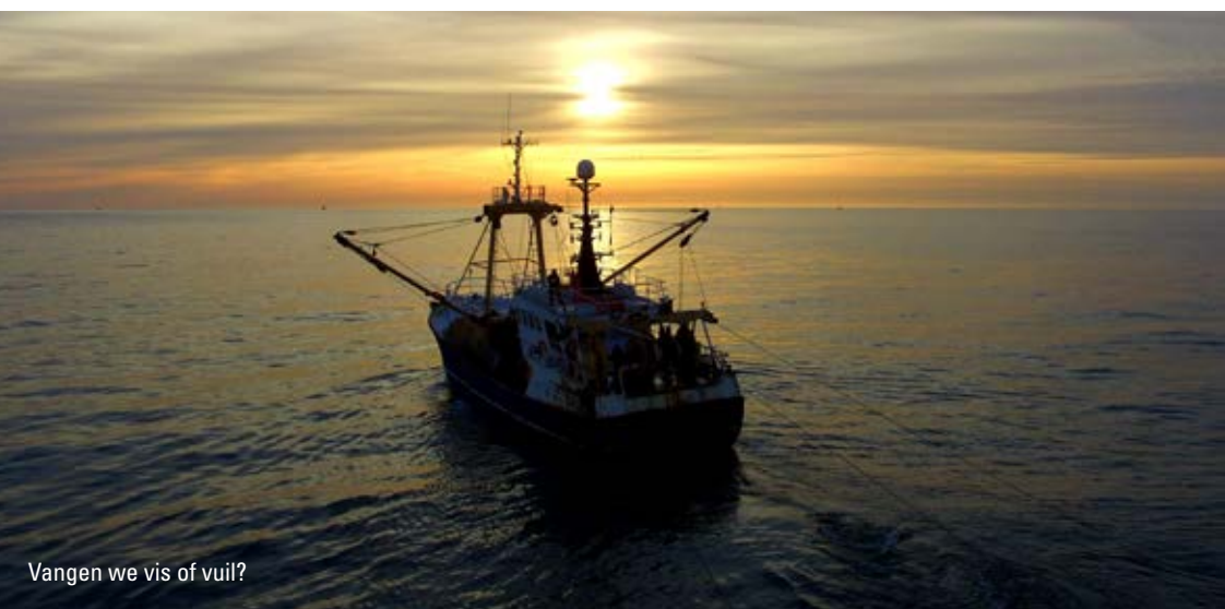
Vangen we vis of vuil?